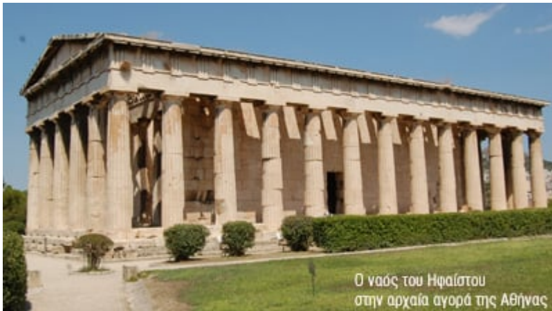
Ο ναός του Ηφαίστου στην αρχαία αγορά της Αθήνας

σοφία, διότι τα πράγματα δεν περιπλέκονται και «βαίνουν ομαλώς». Μένει να το διερευνήσουμε περαιτέρω.