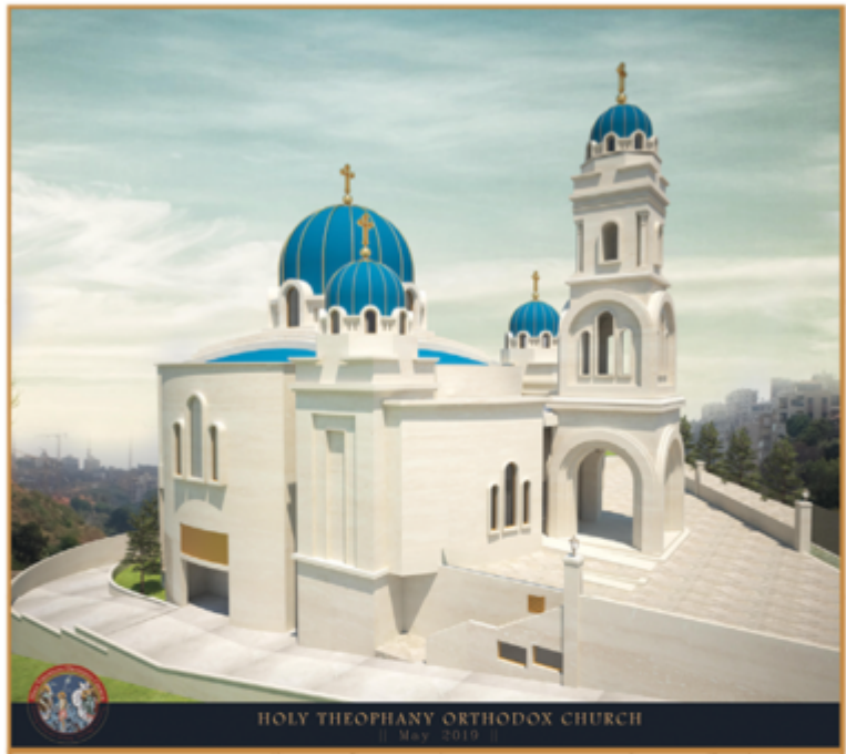
HOLY THEOPHANY ORTHODOX CHURCH [ May 2019 ]