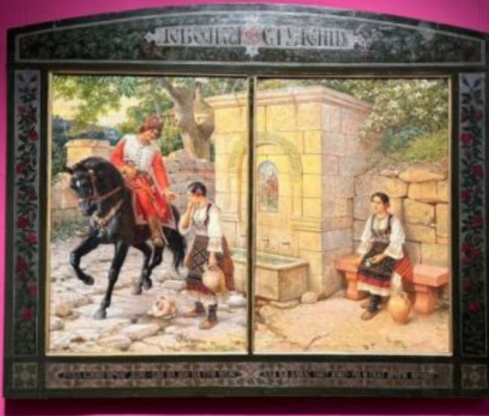
Александр 1888 Музей истории Казахстана