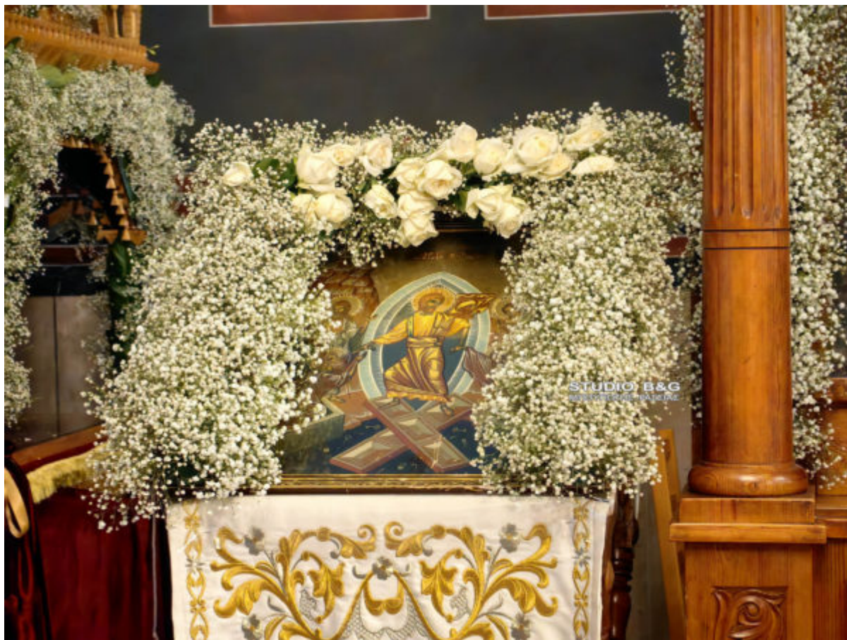
STUDIO B&G ΕΥΑΓΓΕΛΟΣ ΜΠΟΥΓΙΩΤΗΣ - Γ.ΡΑΣΣΙΑΣ