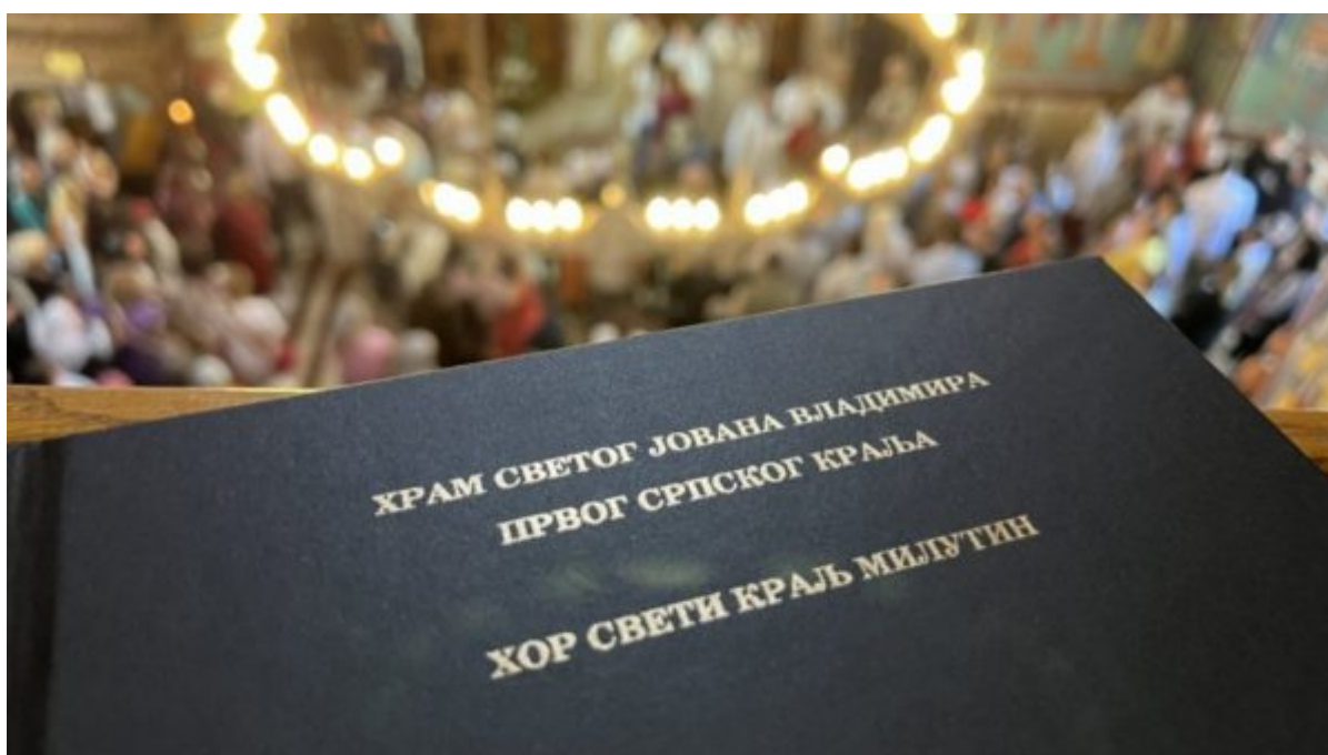
Свети мученик Јован Владимир, Кнез српски