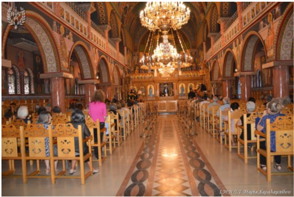
Ι.Μ.Ν.Σ.Τ. Μαρία Λαυλαγκίδου