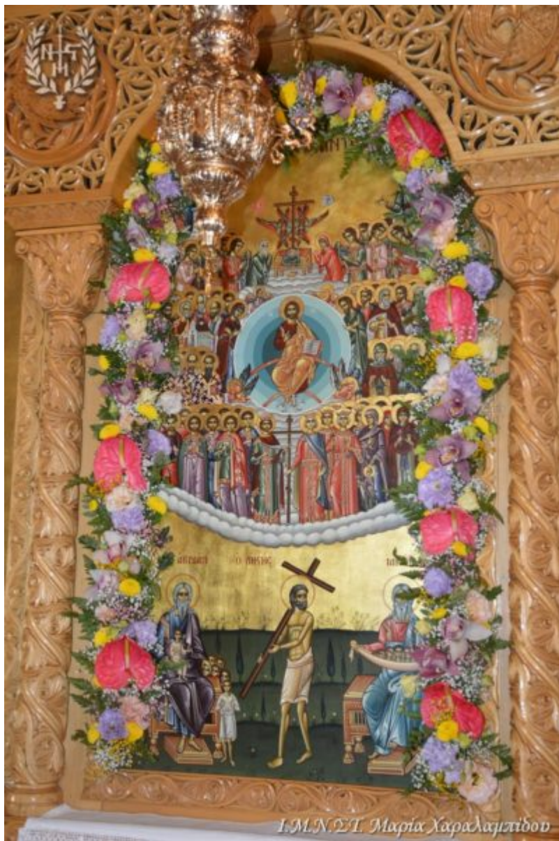
Ι.Μ.Ν.Σ.Τ. Μαρία Χαραλαμπίδου