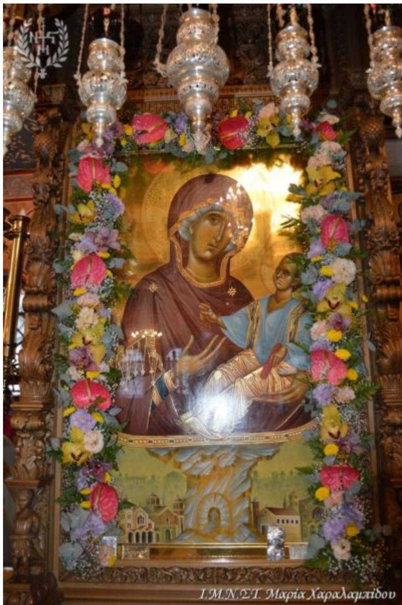
I.M.N.Σ.T. Μαρία Χαραλαμπίδου