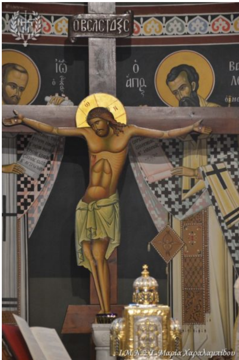
Ι.Μ.Ν.Θ.Α. Μαρία Χαράλαμπιδου