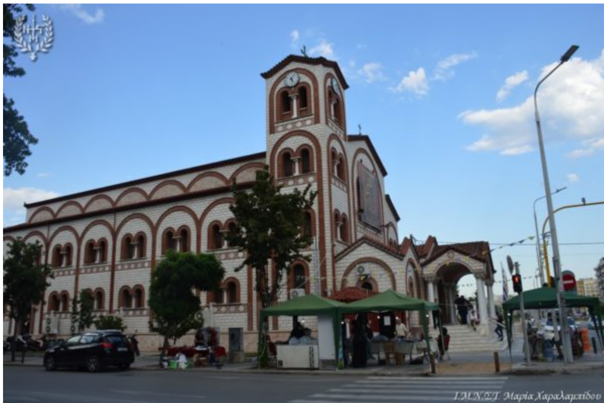
Ι.Μ.Ν.Σ.Τ. Μαρία Χαραλαμπίδου