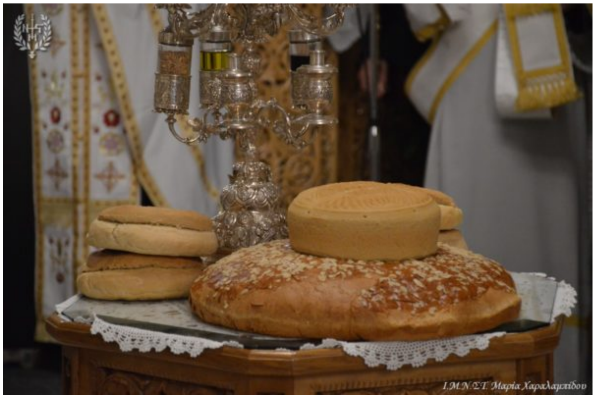
Ι.Μ.Ν.Σ.Τ. Μαρία Χαλαρακίδου