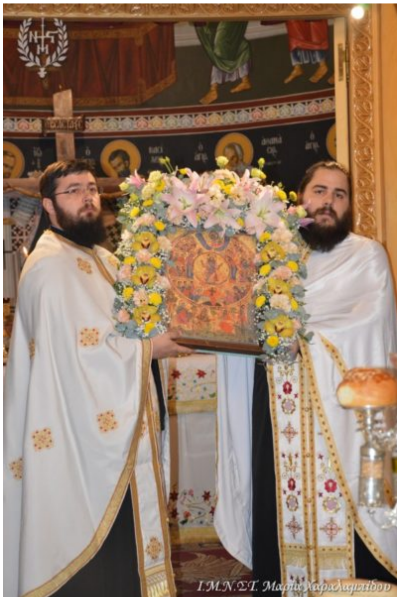
Ι.Μ.Ν.Σ.Τ. Μαριε Χαφελαιζιτου