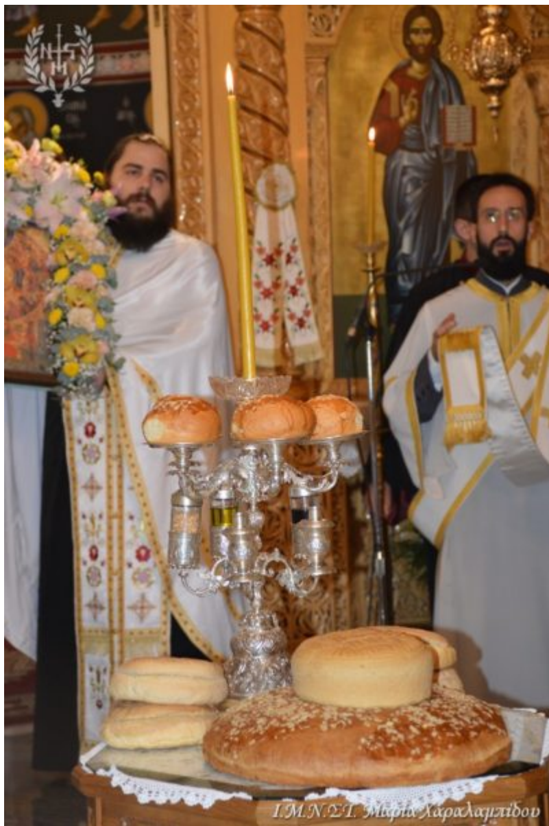
Ι.Μ.Ν.Σ.Τ. Μικρά Χαραλαμπίδου