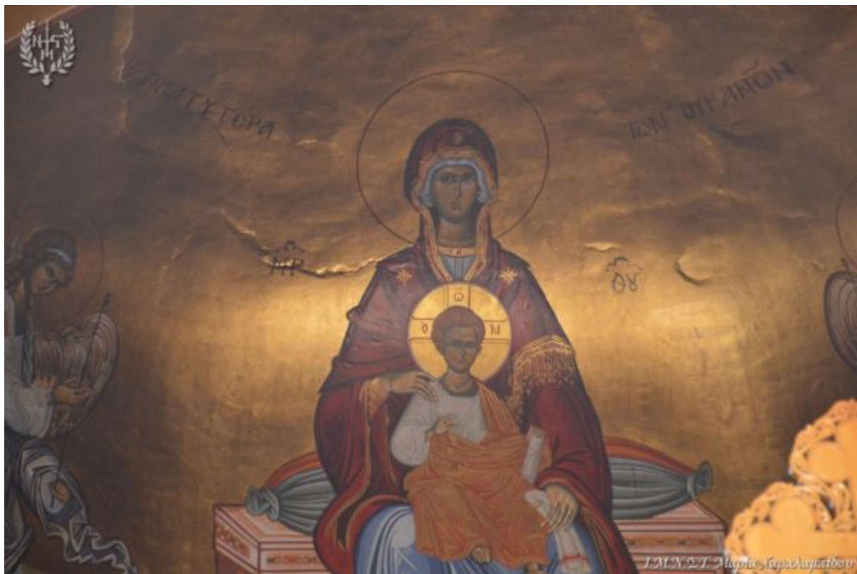
Ι.Μ.Ν.Σ.Τ. Μαρία Χαράλαμειδου