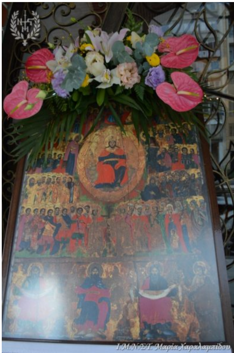
Ι.Μ.Ν.Σ.Τ. Μαρία Χαράλαμπίδου