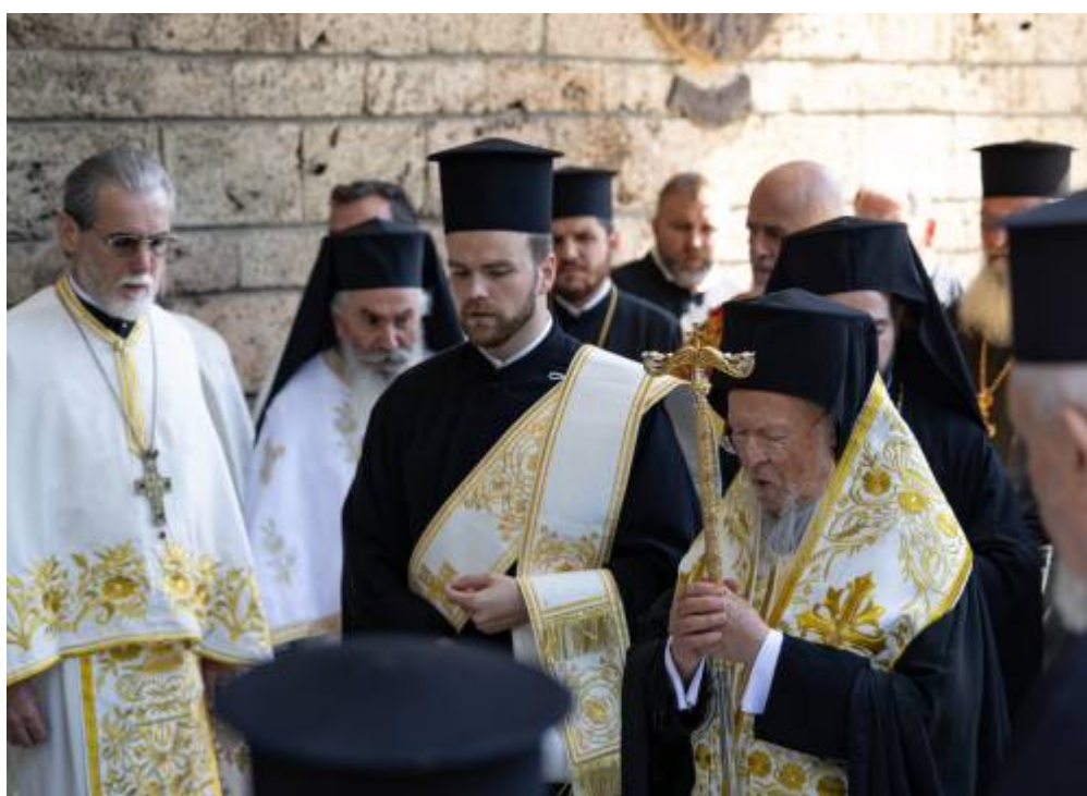
т патр. Вартоломей,