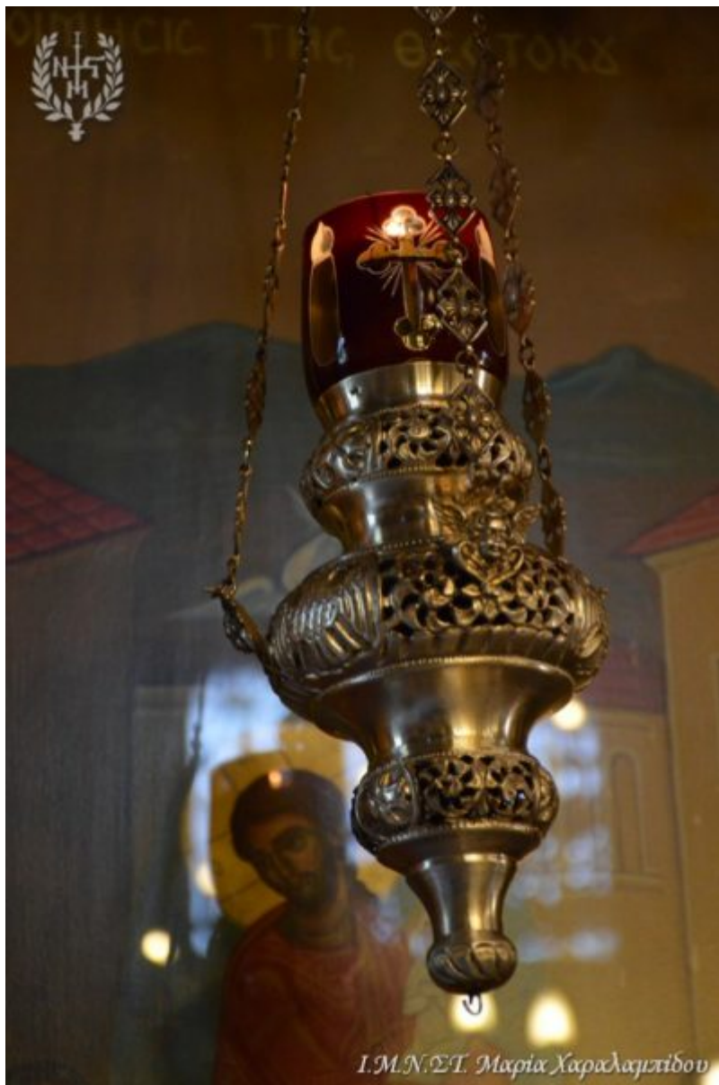
Ι.Μ.Ν.Σ.Τ. Μαρία Χαλαμπίδου