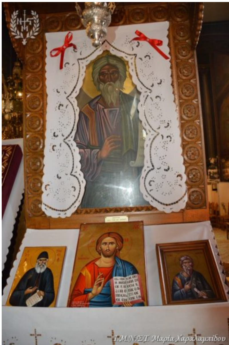
Γ.Μ.Ν.Σ.Τ. Μικρία Χαράλαμπος