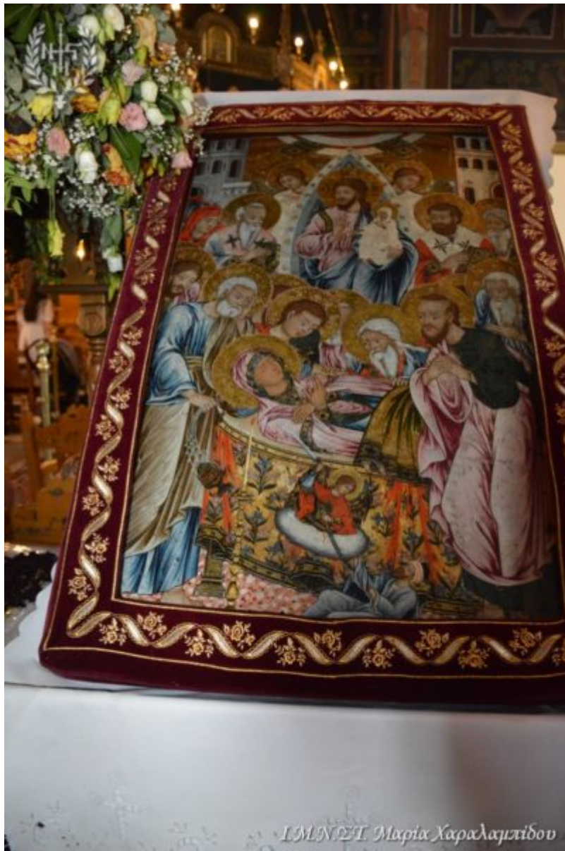
ΙΜΝΕΤΙ Μικρία Χαλαμπίδου