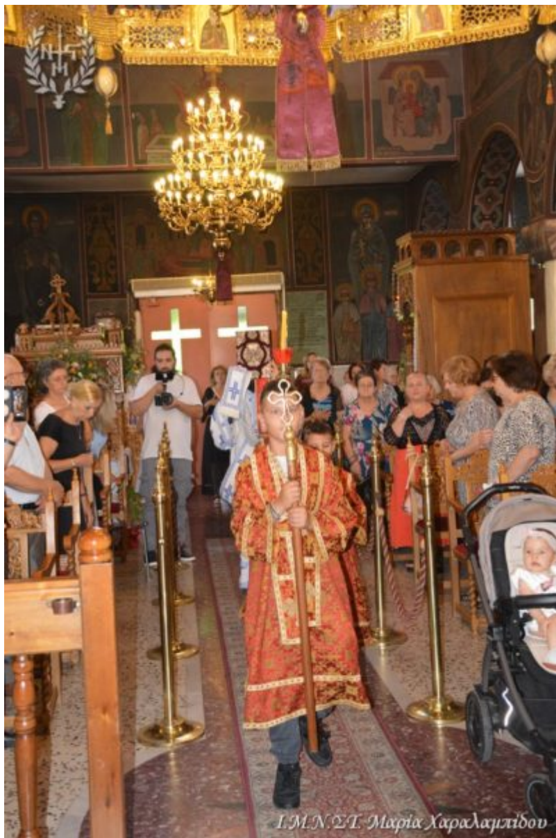
Ι.Μ.Ν.Σ.Τ. Μαρίας Χαραλαμπιδου