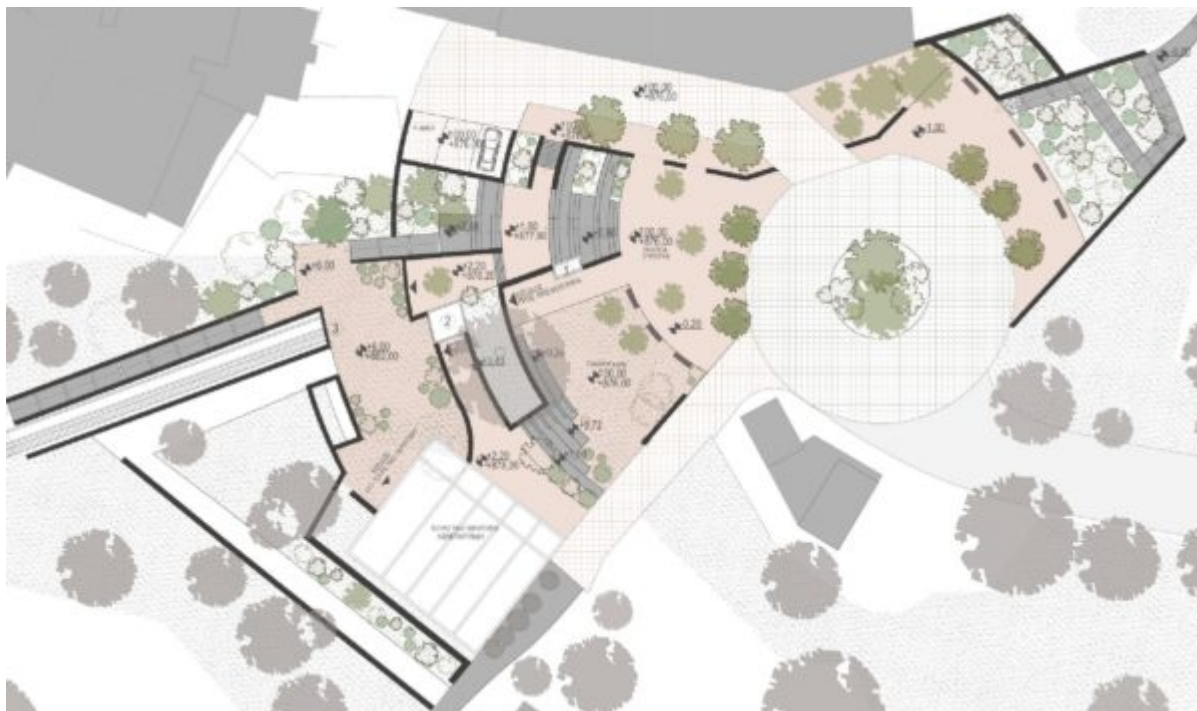
Κάτοψη της ανάπλασης της Πλατείας Ευρώπης