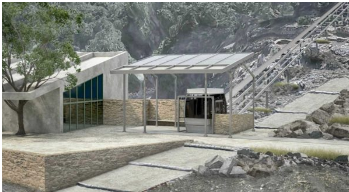
Άποψη του ανελκυστήρα πλαγιάς του Δικταίου Άντρου στο σημείο εκκίνησης