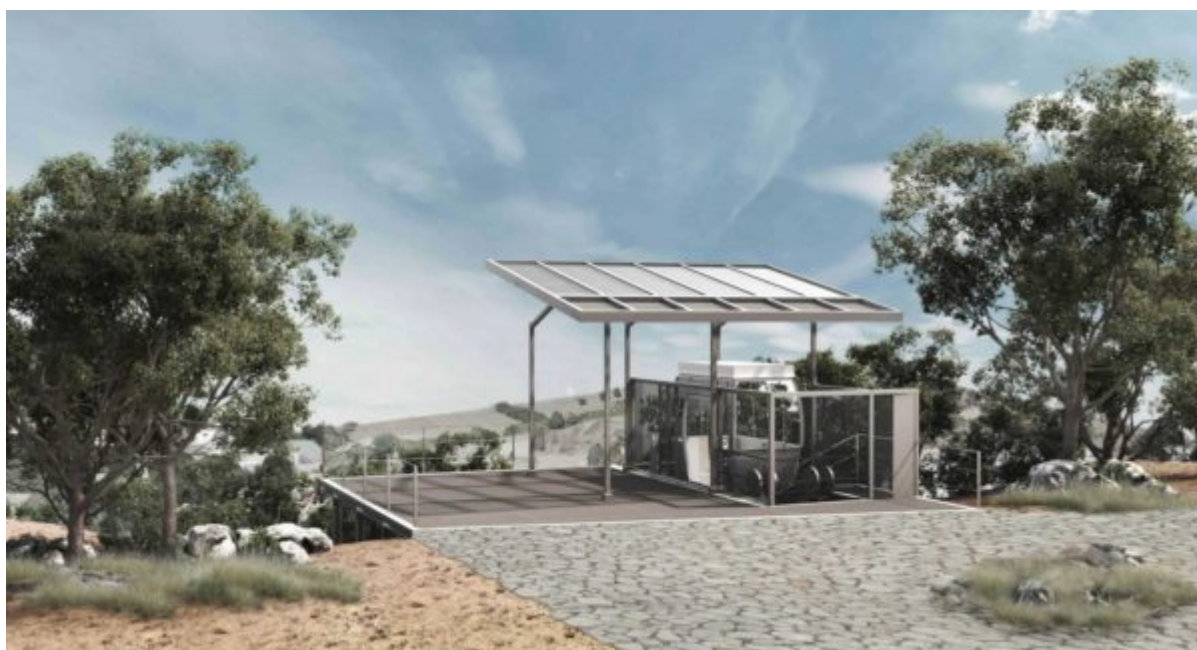
Άποψη του ανελκυστήρα πλαγιάς του Δικταίου Άντρου στη θέση τερματισμού