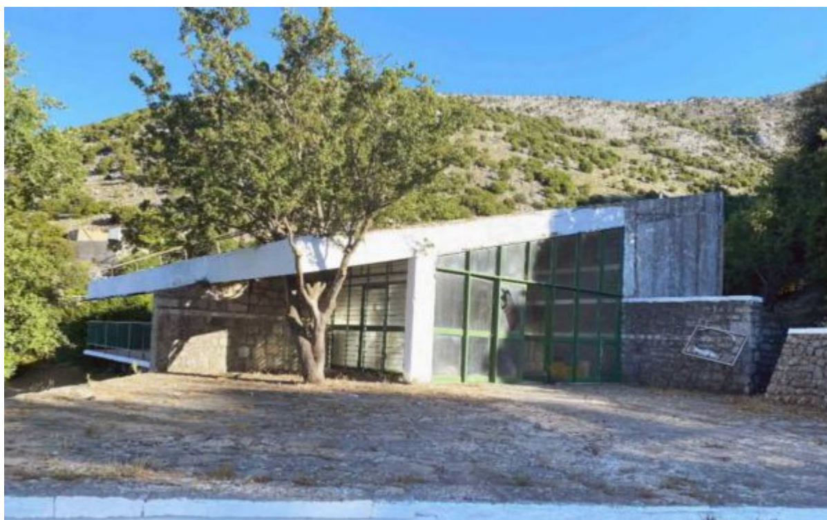
Υφιστάμενη κατάσταση Ξενία στην πλατεία Ευρώπης

Το Κεντρικό Αρχαιολογικό Συμβούλιο ενέκρινε τις μελέτες, την εκπόνηση των οποίων έχει αναλάβει ο Αναπτυξιακός Οργανισμός «Δαίδαλος ΑΕ», στο πλαίσιο Προγραμματικής Σύμβασης Πολιτισμικής Ανάπτυξης μεταξύ του Υπουργείου Πολιτισμού, της Περιφέρειας Κρήτης, του Δήμου Λασιθίου και της «Δαίδαλος ΑΕ». Το έργο χρηματοδοτείται από το Υπουργείο Πολιτισμού με περίπου 16.000.000, ευρώ από πόρους του Ταμείου Ανάκαμψης.