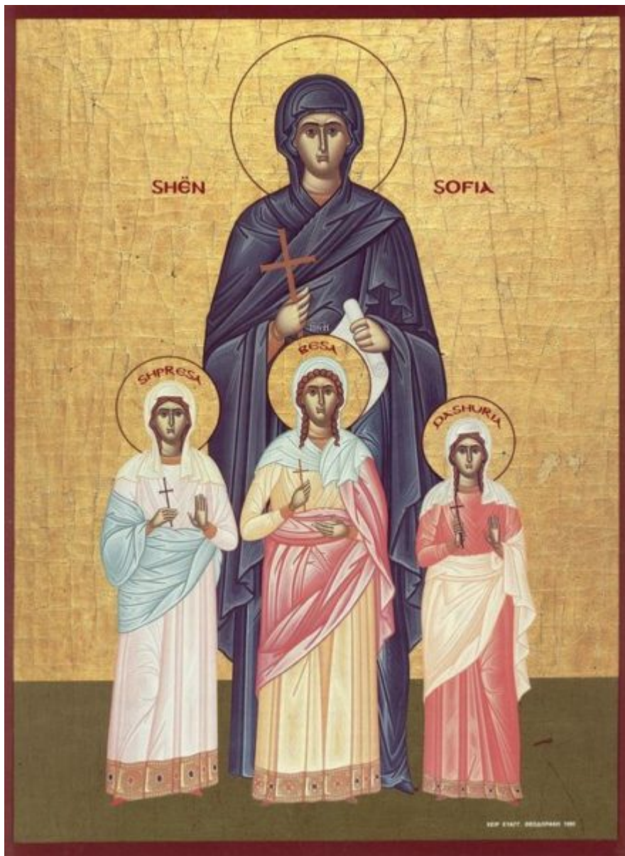
Kisha Orthodhokse Autoqefale e Shqipërisë