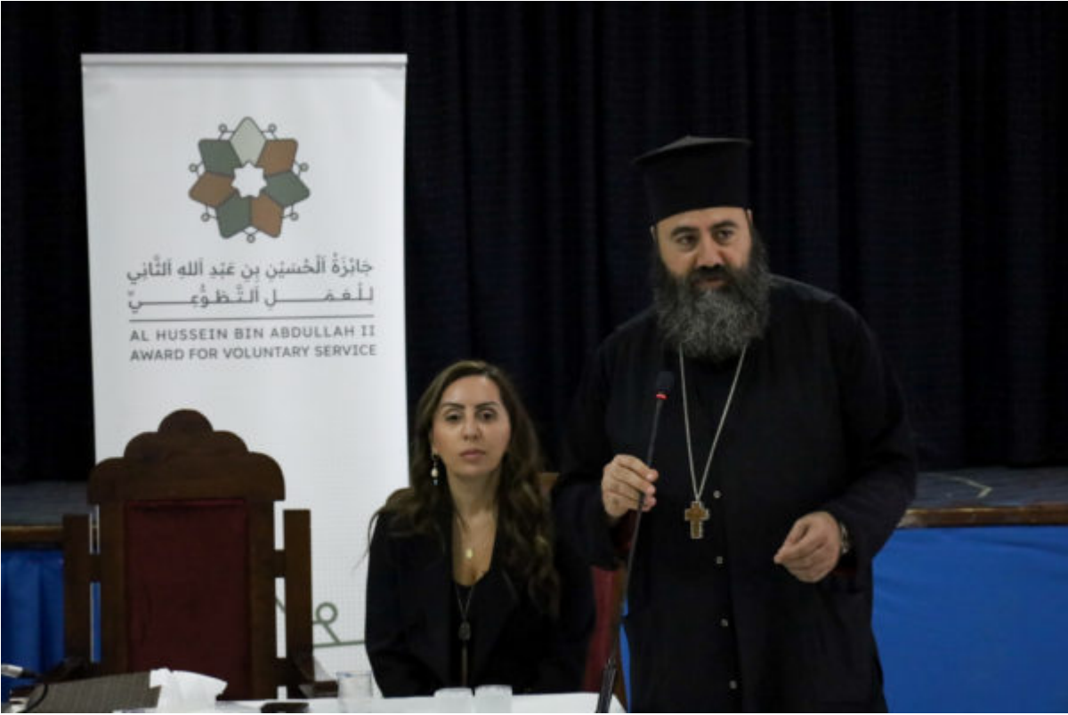
سكذوثرألا مورلل ندرألا ةينارطم - Greek Orthodox Archdiocese Jordan