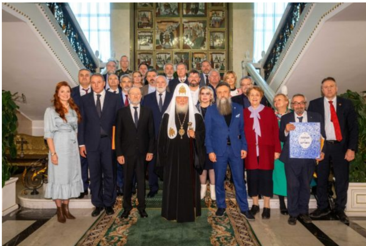
свят. Игорь Палкин