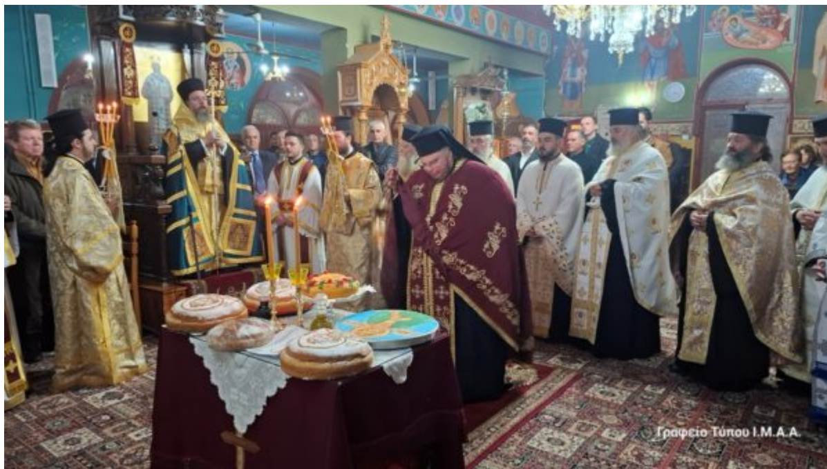
Γραφείο Τύπου Ι.Μ.Α.Α.