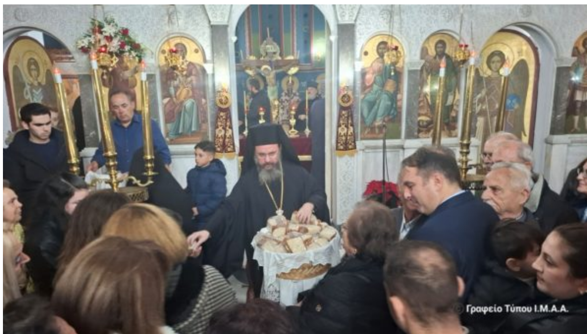
Γραφείο Τύπου Ι.Μ.Α.Α.