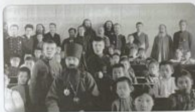
Русские миссионеры и корейские школьники в православной школе

бого. Каждая корейская деревня, не имея средств, старается устроить у себя русскую школу, и благодаря этому в 1900 г. в Приморской области имелось в корейских деревнях 18 школ с 597 учащимися. При посредстве школ распространяется также и православие, которое приняло... многие из взрослых корейцев. Надо думать, православие будет распространяться отсюда и в северные соседние области Кореи...» 21 .