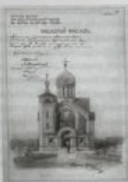
Первый проект храма Св. Николая Чудотворца в Чонане, 1903 г.

Члены Духовной миссии, отбыв к месту назначения, сразу же столкнулись с трудностями. В начале марта 1898 г. на пути в Корею они были остановлены в японском порту Нагасаки. Причиной задержки миссионеров стали политические события в Корее, связанные с усилением японского влияния в стране и падением в ней престижа России. Корею в результате изменения политической обстановки были вынуждены покинуть финансовый советник, дирекция и служащие русско-корейского банка, военные инструкторы. Поверенный в делах Матонии, посчитав, что в таких условиях прибытие русских миссионеров в Корею будет несвоевременным, сообщил об этом министру иностранных дел. Телеграммой из Петербурга члены Миссии были остановлены на пути следования в Нагасаки и отправлены во Владивосток. Отсюда они перебрались в Новоклевет — военный поселок Приморской области, где и находились до конца года в ожидании разрешения дальнейшего путешествия в Корею.