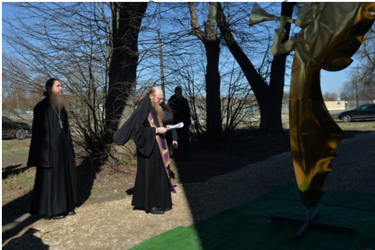
ржке АО я имени