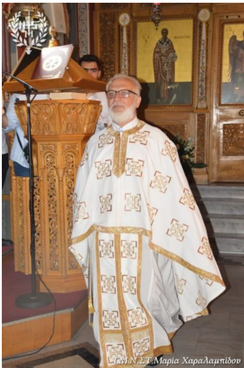
Γ.Μ.Ν. ΣΤ. Μαρία Χαραλαμπίδων