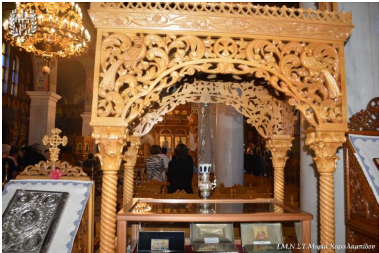
ΙΜΝ. ΣΤ. Μαρία Χαράλαμπίδων