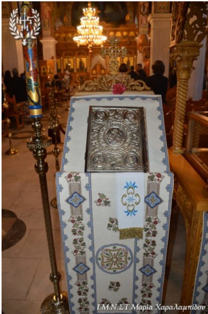
Ι.Μ.Ν.Σ.Τ. Μαρία Χαραλαμπίδου