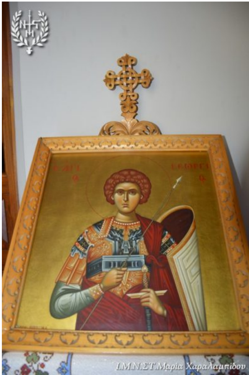
LMN:ΣΤ Μαρία Χαραλιμπίδου