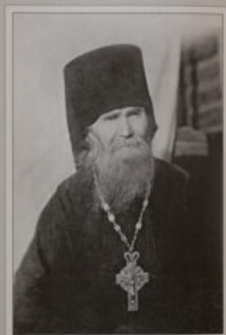
Архимандрит Пансий (Ларин)