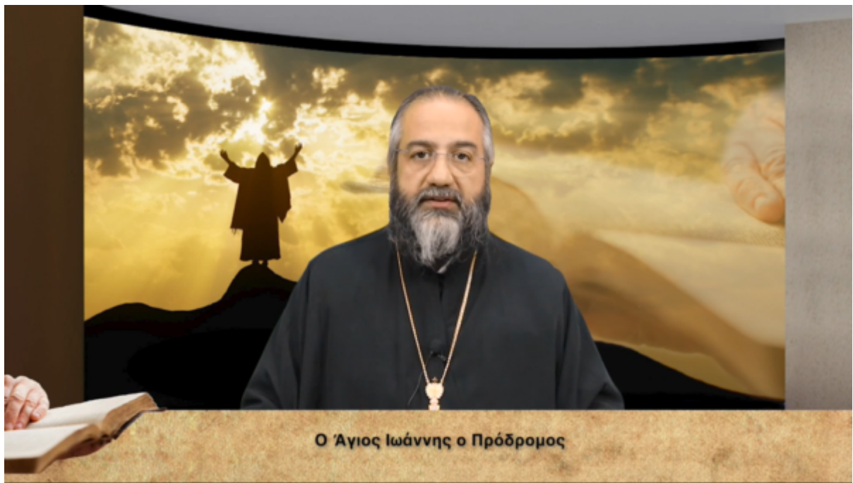
Ο Άγιος Ιωάννης ο Πρόδρομος