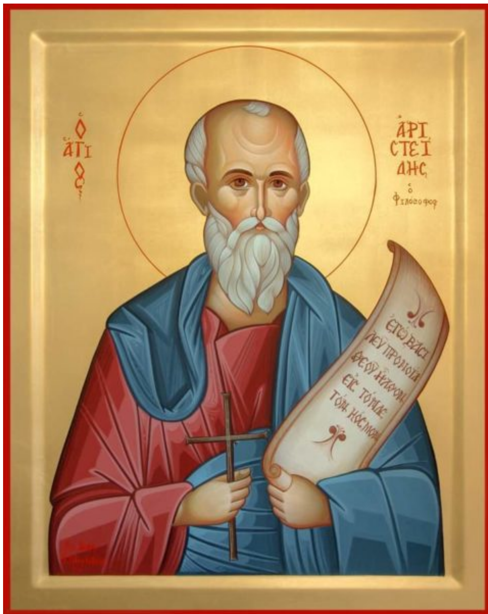
Φορητή εικόνα του Αγίου Αριστείδου διά χειρός Παναγιώτου Μαρκοπούλου στον Ιερό Ναό Κοιμήσεως Θεοτόκου Χρυσοσπηλαιωτίσσης οδού Αιόλου Αθηνών

Ο μεταστραφείς στον χριστιανισμό επιφανής Αθηναίος φιλόσοφος συνέβαλε αποφασιστικά και δυναμικά στην εδραίωση και διάδοση του μηνύματος της χριστιανικής αλήθειας στην «κατείδωλον» πόλη των Αθηνών και αγωνίστηκε με τη φλογερή του πίστη και το σθεναρό του φρόνημα σε μία ιδιαίτερα δύσκολη και κρίσιμη εποχή για την πορεία της Εκκλησίας. Άλλωστε ο αγώνας του για την υπεράσπιση της ακραιφνούς χριστιανικής πίστεως και των αιώνιων αληθειών του Ευαγγελίου του Χριστού ήταν ιδιαίτερα επίπονος και επικίνδυνος, αφού οι ειδωλολάτρες έπρεπε να επηρεαστούν θετικά υπέρ της πίστεως στον έναν και αληθινό Θεό και να σταματήσει η ιουδαϊκή αμφισβήτηση έναντι του χριστιανισμού.