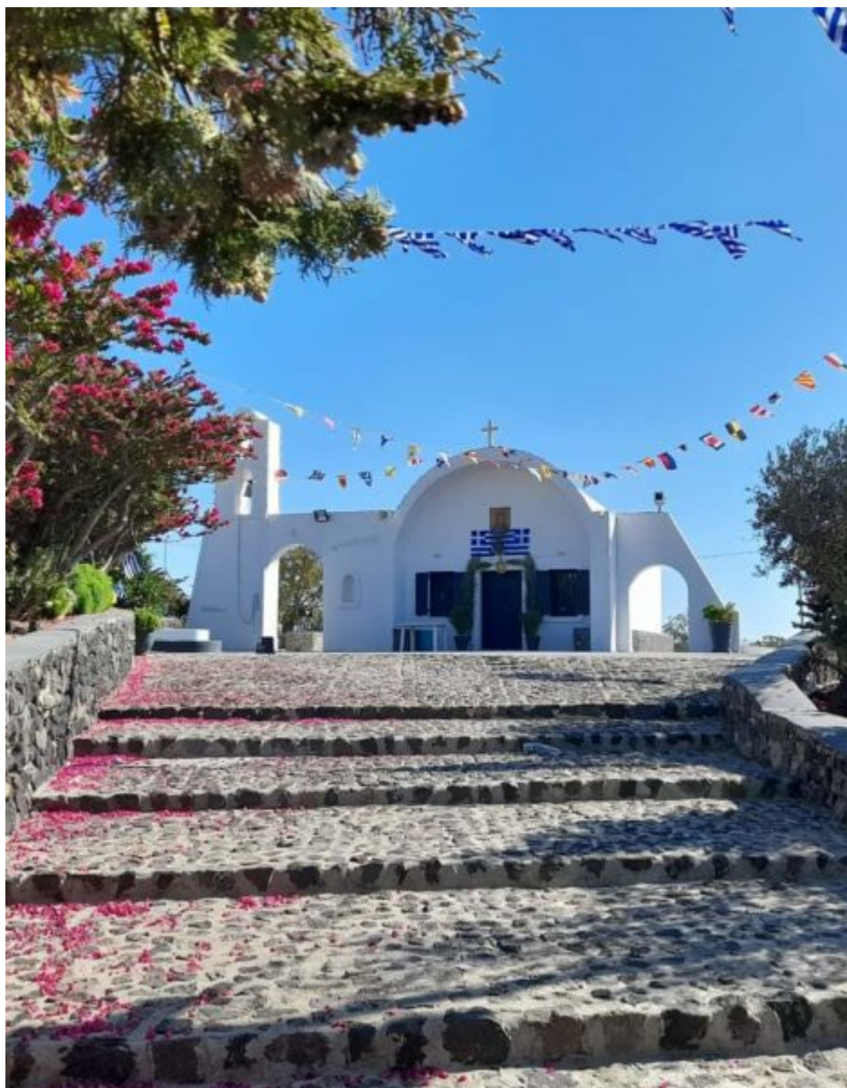
Ο Ιερός Ναός του Αγίου Αριστείδου στις Έξω Κατοικιές Φηρών Σαντορίνης

Αποκορώνου,Λατζιμάς Ρεθύμνου), στις Κυκλάδες με τρεις ναούς (Φηρά Σαντορίνης και δύο ναοί στην Τήνο,στη Στενή και Πανάχραντος Πόρτου ), στα Δωδεκάνησα ( Μενετές Καρπάθου), στη Ρούμελη με δύο ναούς (Αρκίτσα Λοκρίδος και Καρπενήσι), στη Λέσβο με ναό στην ιστορική Ιερά Μονή Λειμώνος,ενώ ναύδριο του αγίου κοσμή και τον προαύλιο χώρο του Ιερού Ναού Αγίου Γρηγορίου Θεολόγου στη συνοικία Γαρδικάκι των Τρικάλων.