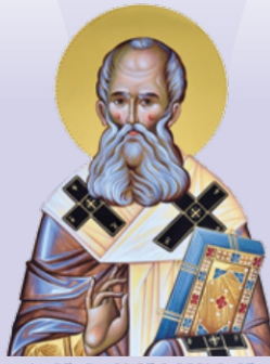
ΑΓΙΟΣ ΓΡΗΓΟΡΙΟΣ Ο ΘΕΟΛΟΓΟΣ