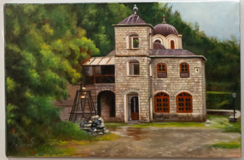
THE HOUSE BY THE SEA