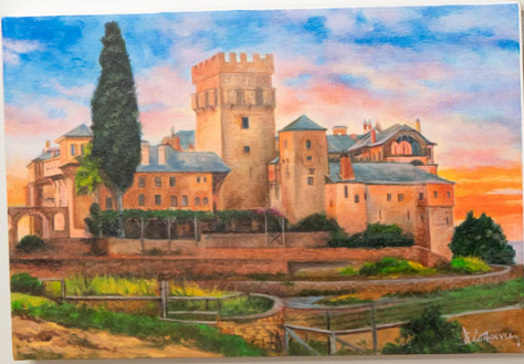
THE CASTLE BY THE SEA