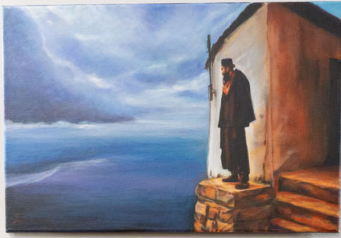
THE MAN WHO STAYED BY THE SEA