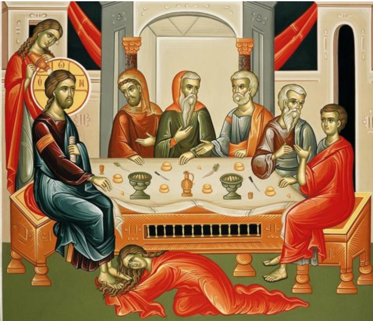
Kisha Orthodhokse Autoqefale e Shqipërisë