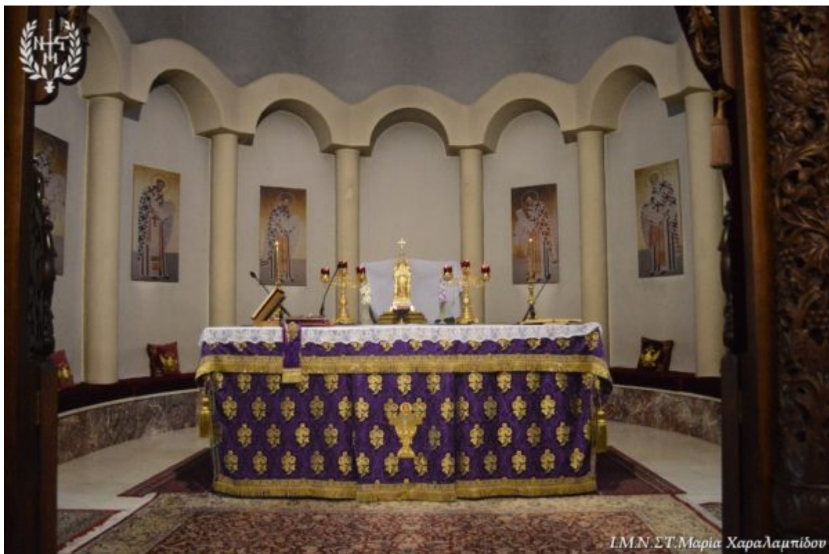
ΙΜΝ. ΣΤ. Μαρία Χαραλαμπίου