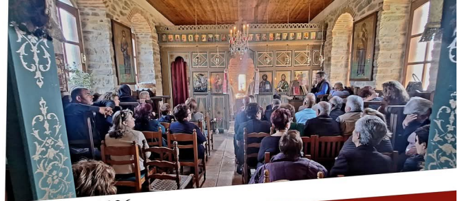
Σάρτη - Πανηγύρι Αγίου Γεωργίου 2026

Τετάρτη, 22 Απριλίου 2026 Λιτάνευση της εικόνας του Αγ. Γεωργίου και Μέγας Εσπερινός μετά αρτοκλασίας Έναρξη 18:00 μ.μ. από τον Ι.Ν. Κοιμήσεως της Θεοτόκου