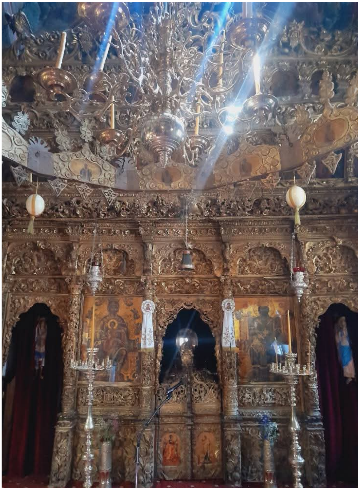
Το τέμπλο φιλοτεχνήθηκε το 1762, χρυσώθηκε το 1768 και φέρει εικόνες και