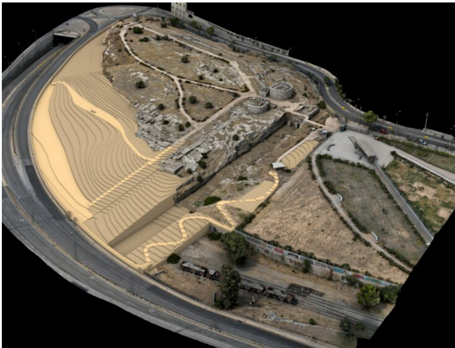
Πρόταση επέκτασης αρχαιολογικού χώρου Ηετιώνειας Πύλης

διέρχονταν αποκλειστικά στρατιωτικές δυνάμεις. Η χρονολόγηση των σωζόμενων οχυρώσεων ανάγεται σε διαφορετικές φάσεις, αρχής γενομένης από τον 5ο αιώνα π.Χ. και συνεχίζεται μέχρι το τέλος του 3ου αιώνα π.Χ. Το μνημείο είχε απλή αρχιτεκτονική, με είσοδο ανάμεσα σε δύο κυκλικούς πύργους και ενισχυόταν από τείχη, τάφρο και προμαχώνες. Η πρόσβαση γινόταν μέσω στενού περάσματος, ενώ πιθανόν υπήρχε κινητή γέφυρα.