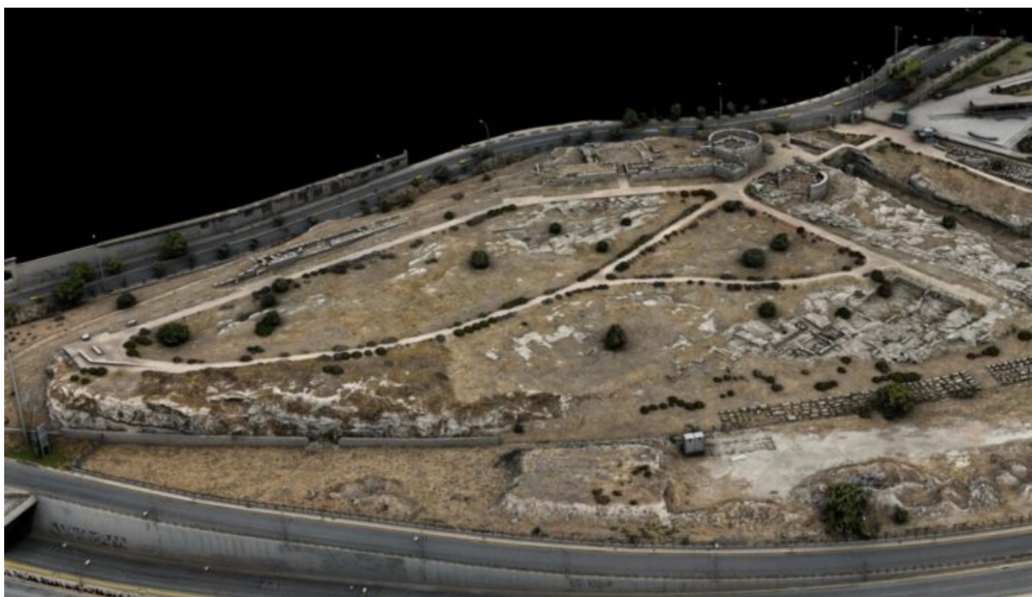
Γενική άποψη του αρχαιολογικού χώρου της Ηετιώνειας Πύλης Πειραιά. Υφιστάμενη

Η επέμβαση συμπληρώνει τη συνολική ανάδειξη του -διαμόρφωση διαδρομών και φυλακίου εισόδου, φυτεύσεις, ενημερωτικές πινακίδες- και την αποκατάσταση των πύργων της οχύρωσης, με στόχο τη βελτίωση της εμπειρίας των επισκεπτών και την καθολική προσβασιμότητα. Δια της αρμόδιας Εφορείας Αρχαιοτήτων Πειραιώς και Νήσων ολοκληρώθηκαν οι μελέτες συντήρησης και στερέωσης των καταλοίπων της οχύρωσης, η αρχιτεκτονική και στατική μελέτη αποκατάστασης του ανατολικού κυκλικού πύργου, η αρχιτεκτονική, γεωτεχνική και υδραυλική μελέτη για την ανάδειξη του συνόλου του αρχαιολογικού χώρου, όπως πληροφορεί ανακοίνωση του ΥΠΠΟ.