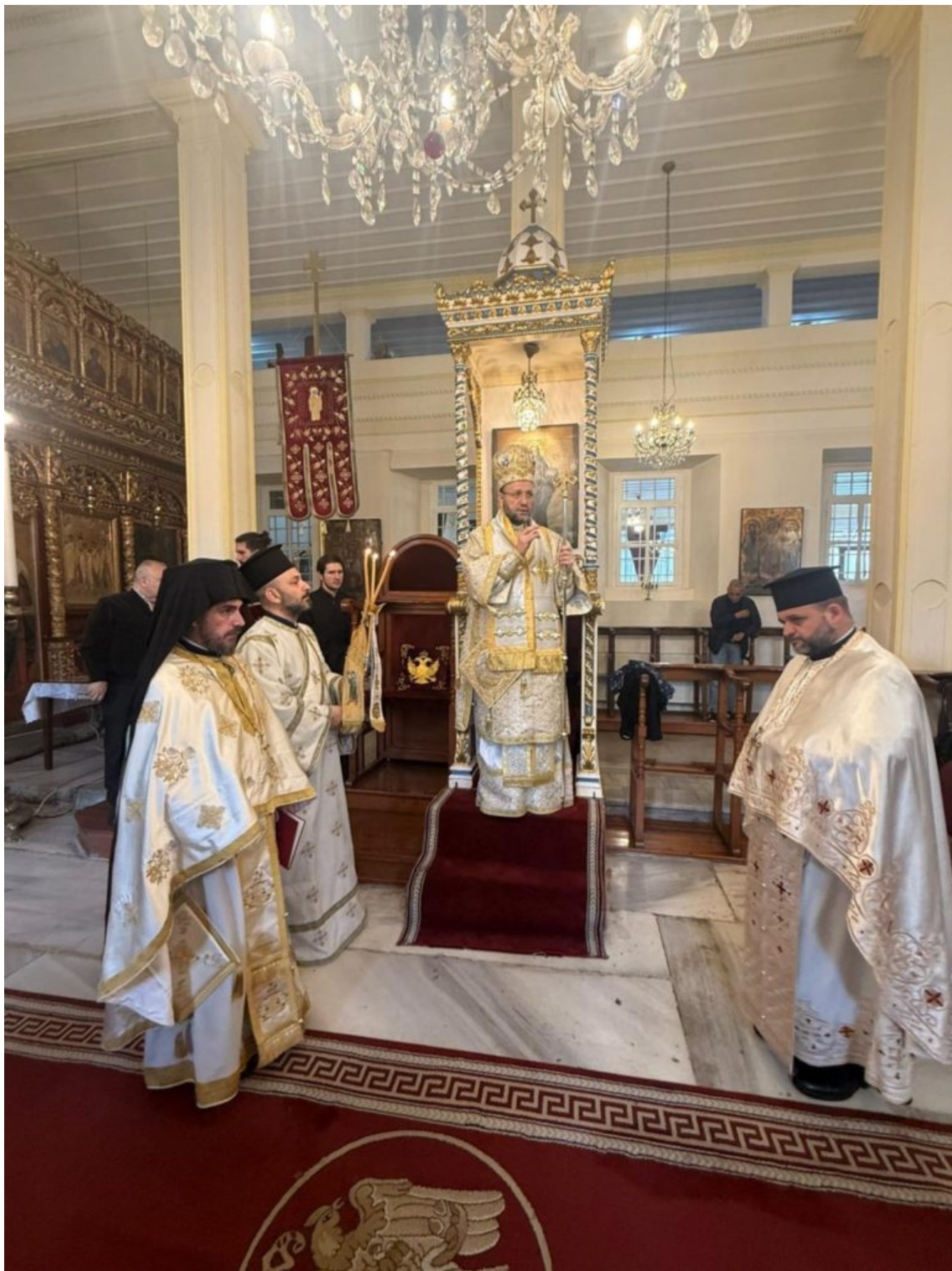
Η Θεία Λειτουργία τελέστηκε στην Ελληνική και τη Ρουμανική γλώσσα, προς