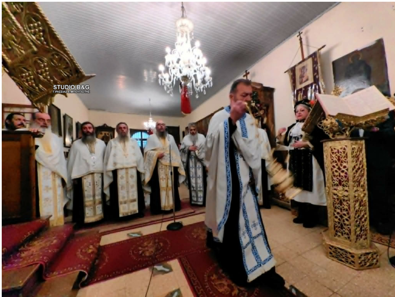
STUDIO B&G ΕΥΑΓΓΕΛΟΣ ΜΠΟΥΓΙΩΤΗΣ - Γ.ΡΑΣΣΙΑΣ