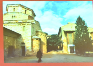
Μετόχι της Αγίας Σώτηρας στο Σολάν της Γαλλίας. Dependency of the Protection of the Mother of God, Solan, France.