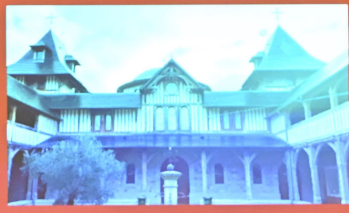
Μετόχι της Μεταμορφώσεως του Σωτήρος στην Τερασόν της Γαλλίας. Dependency of the Transfiguration of Christ, Terrasson, France.