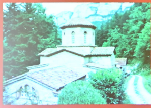
Μετόχι του Αγίου Αντωνίου του Μεγάλου στη Γρενόμπλ της Γαλλίας. Dependency of Saint Anthony the Great in Grenoble, France.