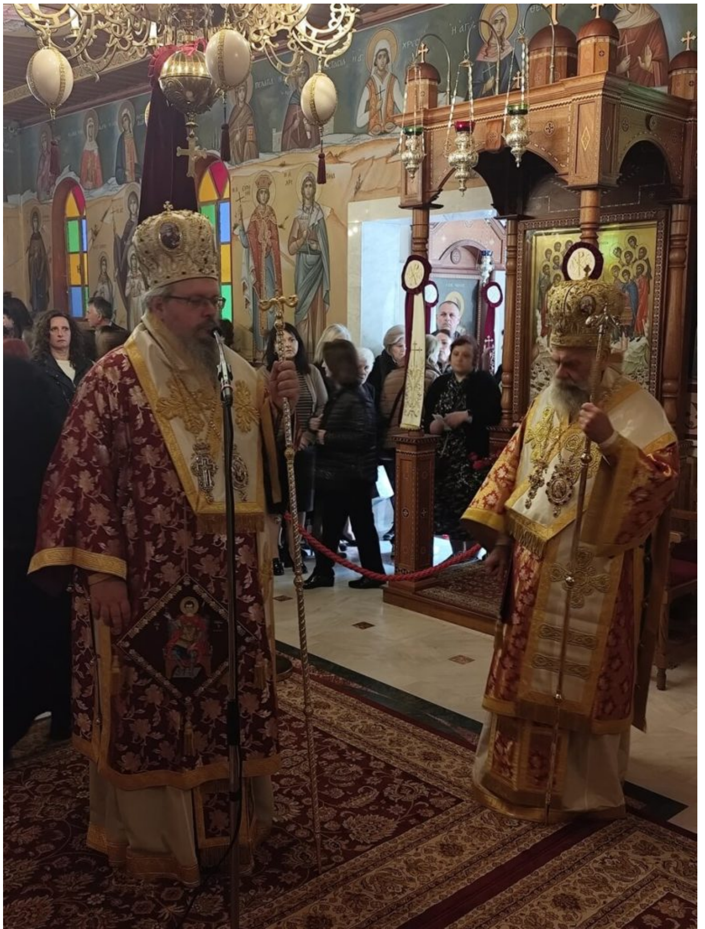
Αναφερόμενος στα χρόνια της ασκήσεως του Αγίου στα Βούναινα, ο