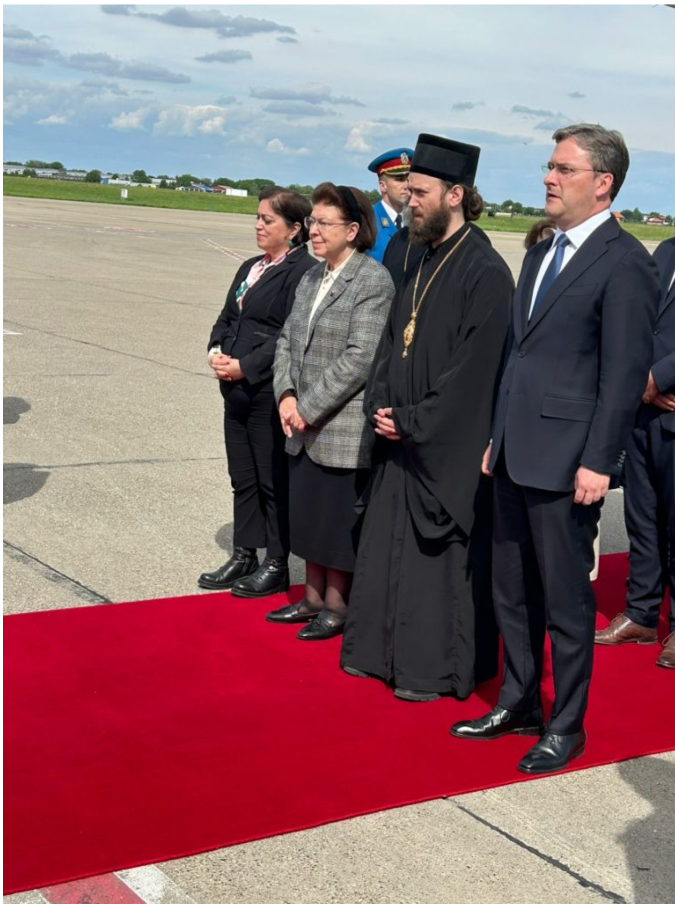
Η Υπουργός Πολιτισμού Λίνα Μενδώνη, ο Υπουργός Πολιτισμού της Σερβίας Nikola