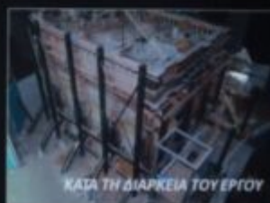
ΚΑΤΑ ΤΗ ΔΙΑΡΚΕΙΑ ΤΟΥ ΕΡΓΟΥ