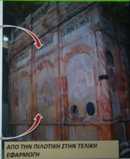
ΑΠΟ ΤΗΝ ΠΙΛΟΤΙΚΗ ΣΤΗΝ ΤΕΛΙΚΗ ΕΦΑΡΜΟΓΗ