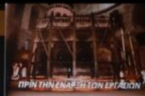
ΠΡΙΝ ΤΗΝ ΕΝΑΡΞΗ ΤΩΝ ΕΡΓΑΣΙΩΝ