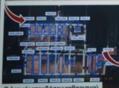
Πιλοτικές επεμβάσεις καθαρισμού