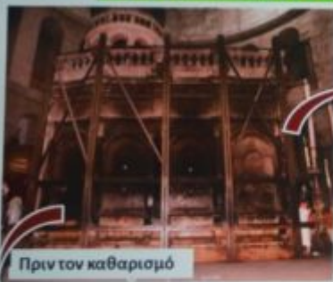
Πριν τον καθαρισμό