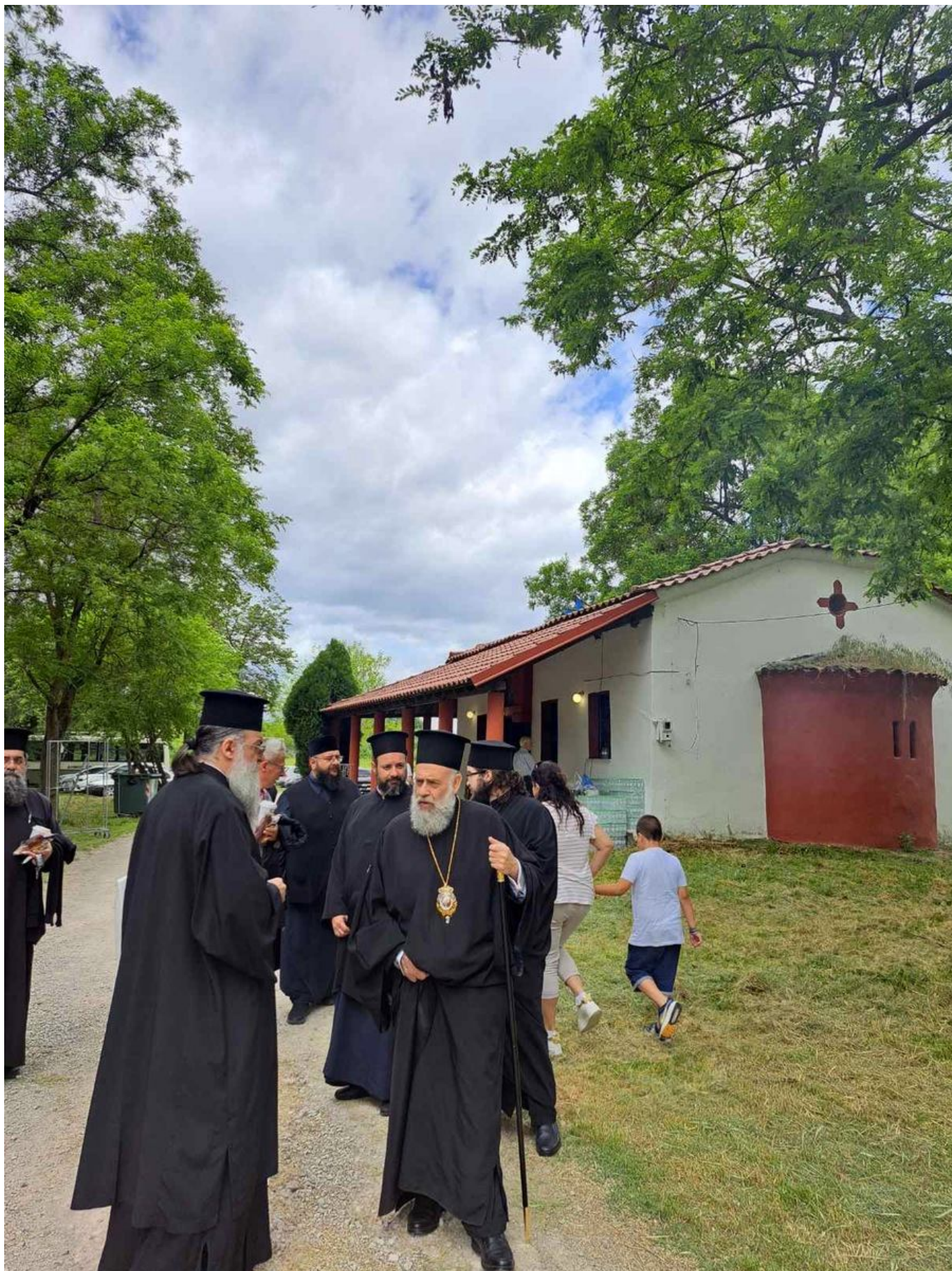
Με λόγο γεμάτο ποιμαντική ευθύνη και αγωνία για τη νέα γενιά, ο Σεβασμιώτατος