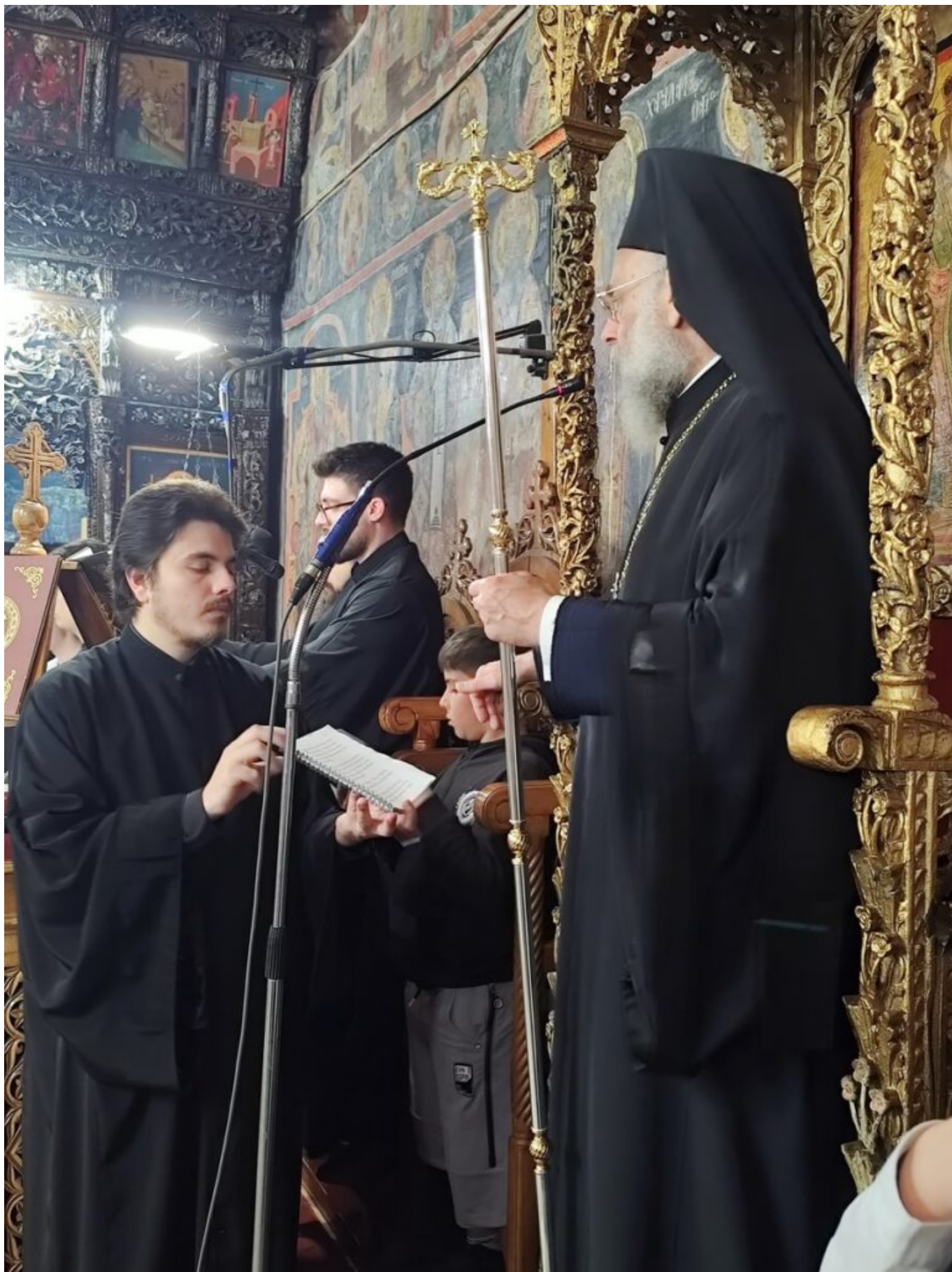
Στο τέλος της Ιεράς Παρακλήσεως ο Σεβασμιώτατος κατήλθε στον κυρίως Ναό,