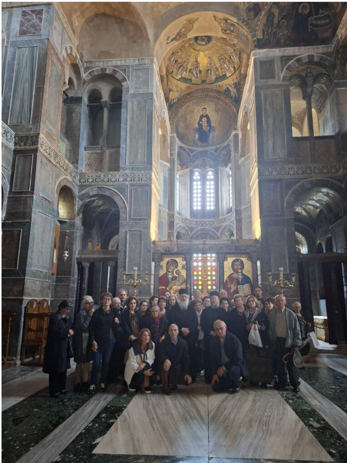
Μετά το μεσημβρινό γεύμα στη Λιβαδειά, ακολούθησε το προσκύνημα στην Ιερά Μονή Αγίου Γεωργίου Μαυροματίου Θηβών