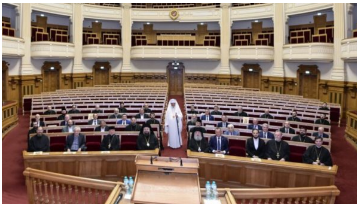
Poză de grup cu membrii noii Adunări Eparhiale a Arhiepiscopiei Bucureștilor. 29.05.2026.

Adunarea eparhială este organismul deliberativ pentru toate problemele administrative, culturale, social-filantropice, economice și patrimoniale ale eparhiei.