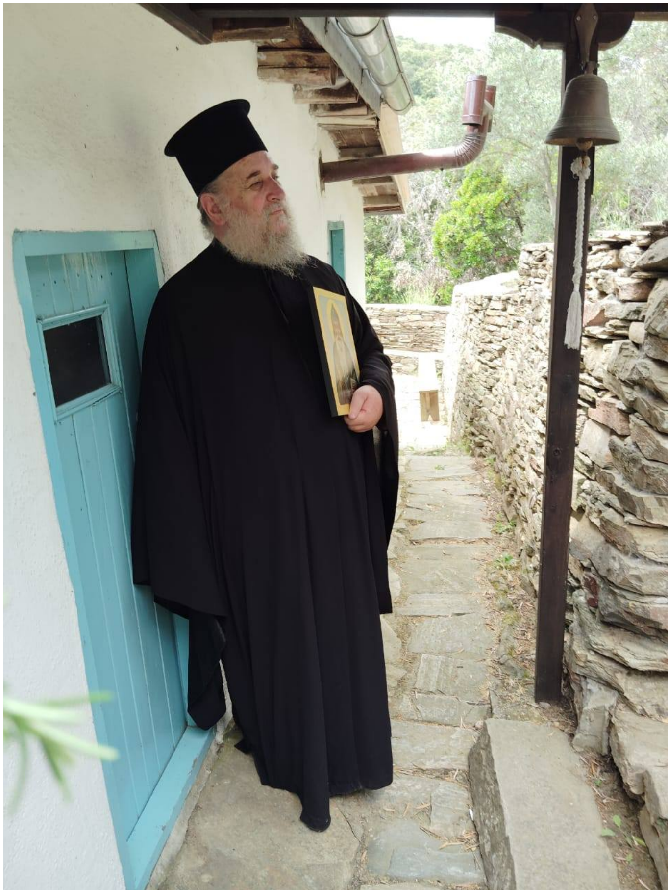
Επίσης, ο Μητροπολίτης κ. Κύριλλος επισκέφθηκε και την Ιερά Κοινότητα του