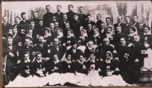
Το 1904 ζουν οι Ρωσιστανικοί κάτοικοι. Ο πατέρας τους Βασίλιος με αδελφούς τους "Επιφάνη Σαγματά" διακοσμούν για την "Ασία Ασιατική". Έτσι προετοιμάζουν τις διαγραφές τους στους γραμμάτις σπουδάζοντας. Ο Βασίλιος διακρίνεται πρώτος από όλους.