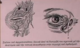
Σχέση του άρρωστου οφθαλμού από τη διαταγή του σκελετού με την διαταγή και την κοινή διακρίνωση στην περιοχή του οφθαλμού.