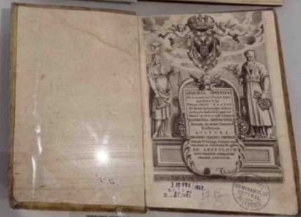
LIBRARIIS J. B. COIGNARD & C. LIBRARIUM GALLIÆ 1772