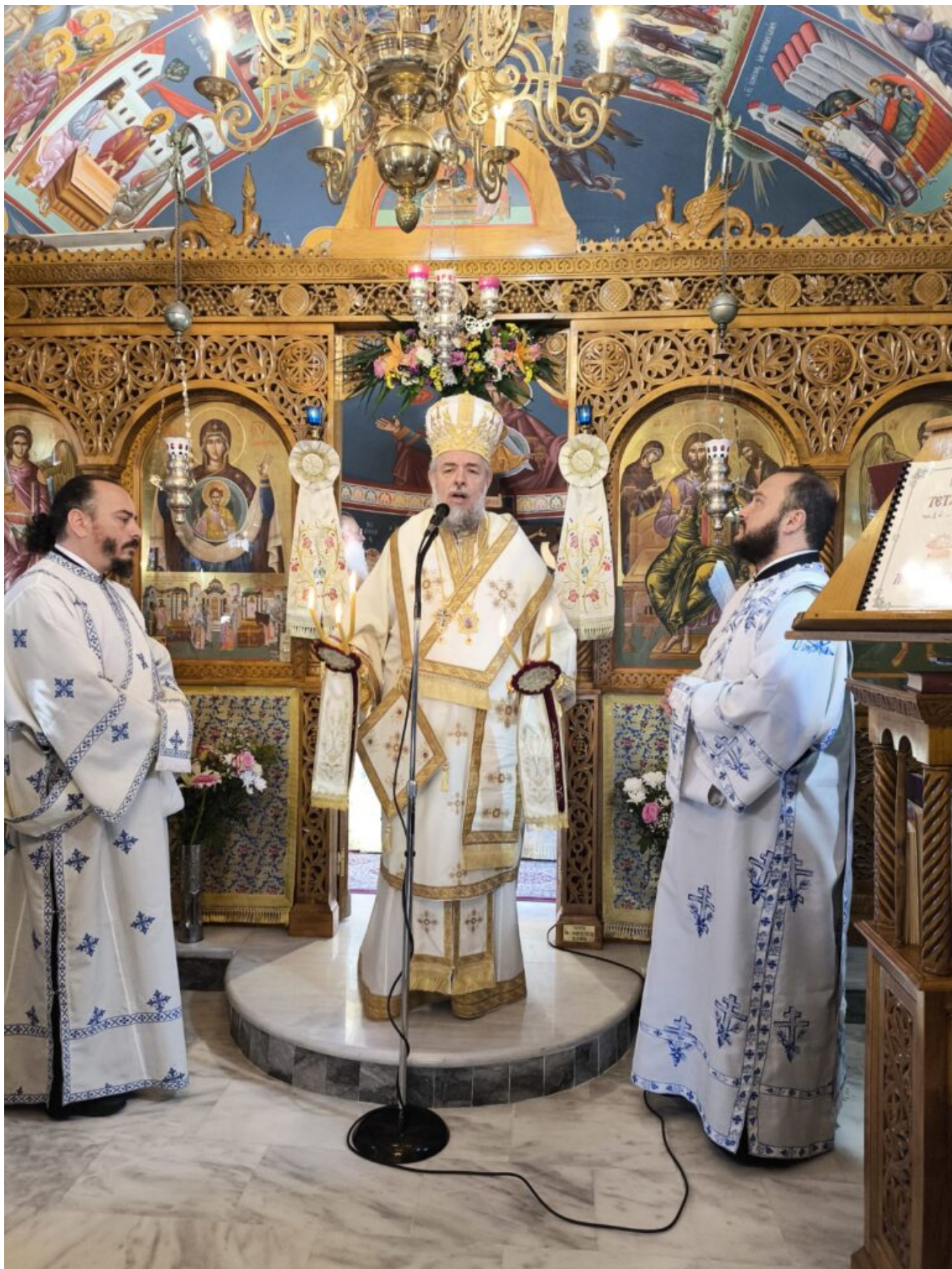
Ιδιαίτερη αναφορά έκαμε ο Σεβασμιώτατος στον μακαριστό π. Ανανία Κουστένη, ο