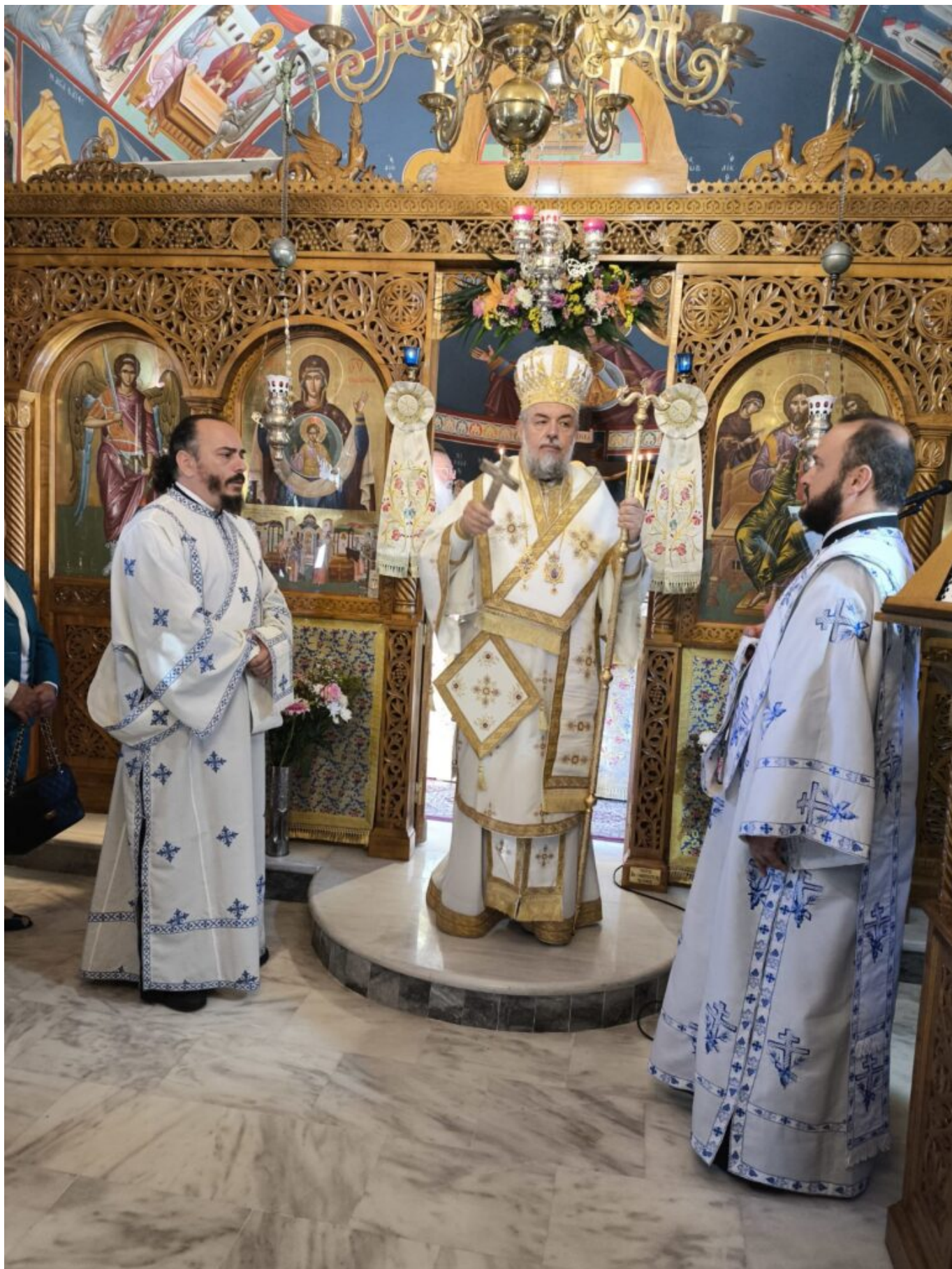
Μετά το πέρας της Θείας Λειτουργίας τελέσθηκαν, στον αύλειο χώρο του Ιερού