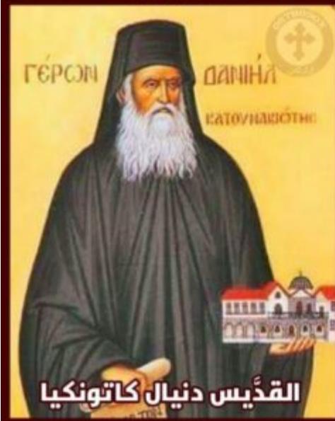
القديس دانيال كاتونكيا