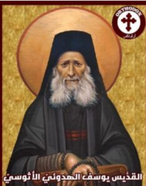
القديس يوسف المحدثي الأثوسي