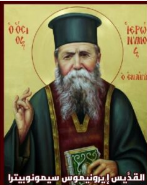
القديس إيريونيμος سيمونوبيترا