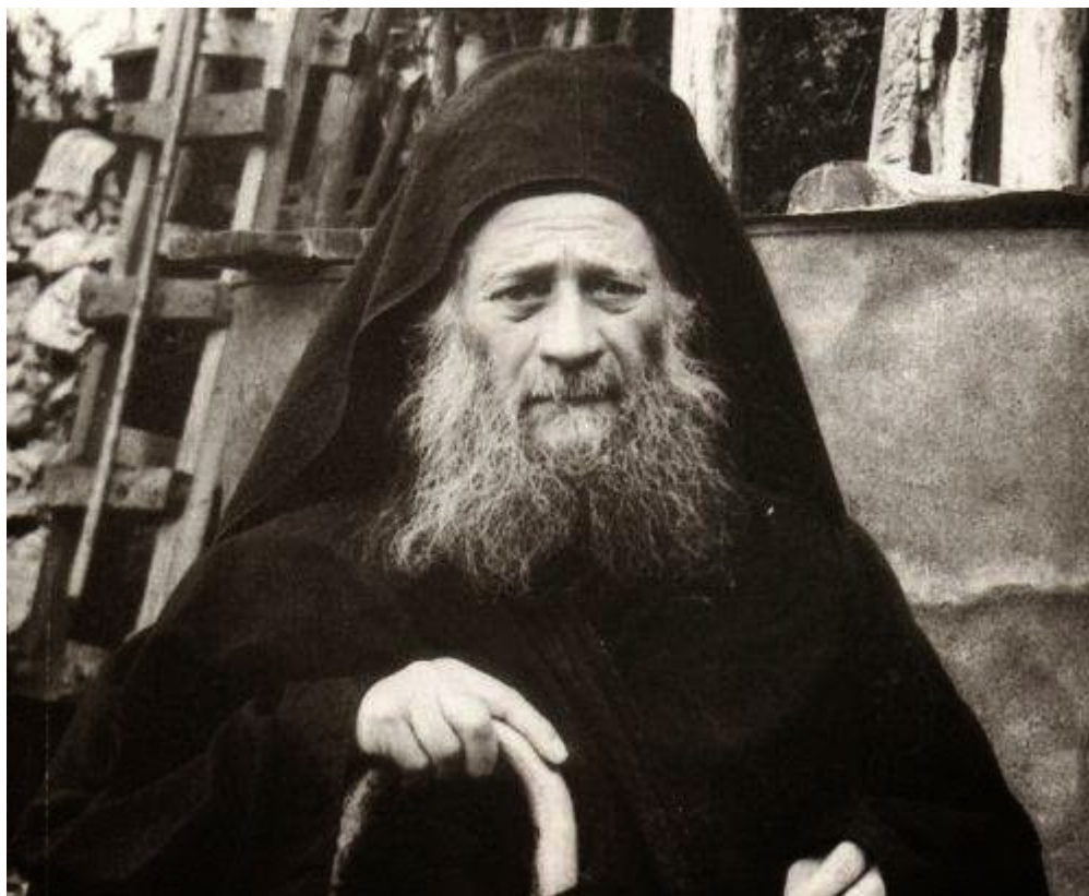
ΓΕΡΩΝ ΑΡΣΕΝΙΟΣ ΣΠΗΛΑΙΩΤΗΣ (+1983)