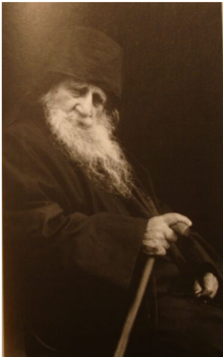
ΓΕΡΩΝ ΕΦΡΑΙΜ ΚΑΤΟΥΝΑΚΙΩΤΗΣ (+1998) - ΤΟ ΠΟΛΥΑΓΑΠΗΜΕΝΟ “ΑΤΥΠΟ” ΜΕΛΟΣ ΤΗΣ ΣΥΝΟΔΕΙΑΣ ΤΟΥ ΙΩΣΗΦ ΤΟΥ ΗΣΥΧΑΣΤΟΥ