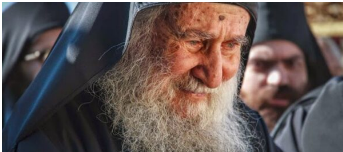
ΓΕΡΩΝ ΕΦΡΑΙΜ ΑΡΙΖΟΝΑΣ (+2019)