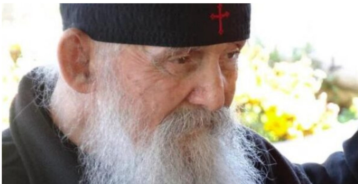
Επιμέλεια: Κώστας Παναγόπουλος - ΠΡΑΚΤΟΡΕΙΟ "ΟΡΘΟΔΟΞΙΑ"