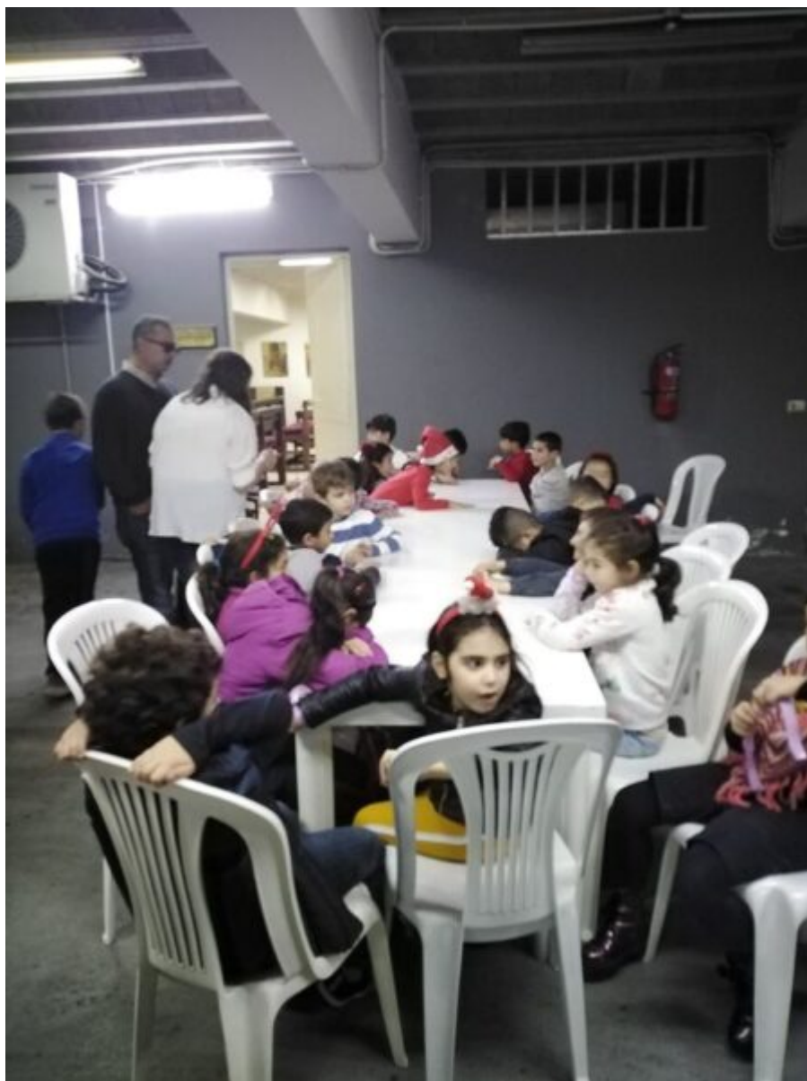
Christian Orthodox Archdiocese of Mount Lebanon