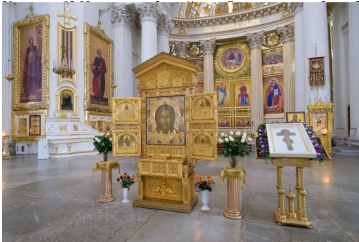
Изображение иконостаса с образом "Спасителя на Кресте"

После молебна была вознесена молитва о здравии во время распространения вредоносного поветрия.