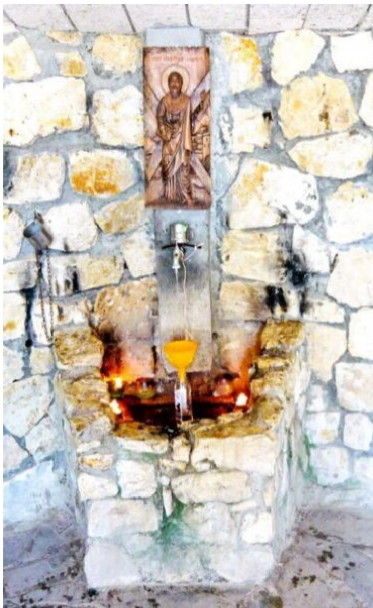
Izvorul tămăduitor de la Brăila

Izvorul Tămăduirii transforma, până anul acesta, orașul Brăila în loc de pelerinaj pentru credincioși sosiți din toată țara să primească agheasmă de la izvorul vindecător din oraș. În anul 1863, în timpul lucrărilor de punere a temeliei Bisericii „Buna Vestire” a comunității grecești din orașul dunărean, unul dintre ctitori a avut un vis care a dus la descoperirea acestui izvor natural, cu proprietăți vindecătoare de ziua Izvorului Tămăduirii. A fost considerat un semn divin, izvorul închizându-se într-o fântână, iar deasupra construindu-se Sfântul Altar.