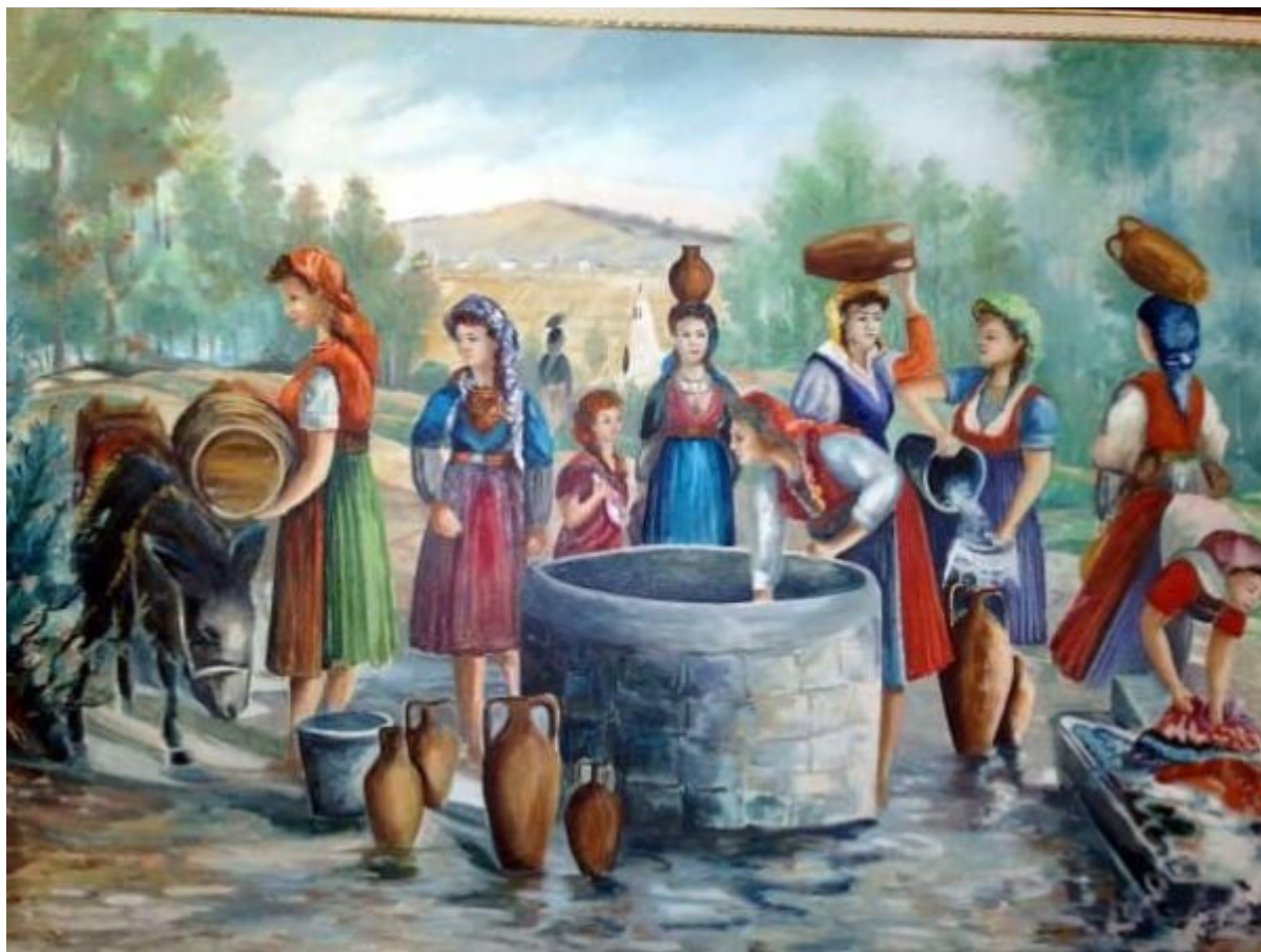
Κείμενο - Φωτογραφίες: Σελίδα facebook Νεολαία Βορειοηπειρωτών