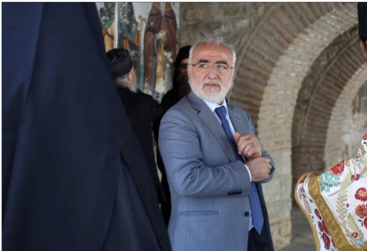
Ο ιδρυτής του Ιδρύματος, Ιβάν Σαββίδης

Επίσης, πρόσφατα το Φιλανθρωπικό Ίδρυμα “Ιβάν Σαββίδης” βοήθησε τα νοσοκομεία στην Περιφέρεια του Ροστόφ προμηθεύοντας υγειονομικό εξοπλισμό αξίας 250.000 ευρώ και πόσιμο νερό. Επιπλέον, συνεισέφερε στην οργάνωση καθημερινών ζεστών γευμάτων για γιατρούς που ειδικεύονται στην θεραπεία ασθενών με κορωνοϊό.