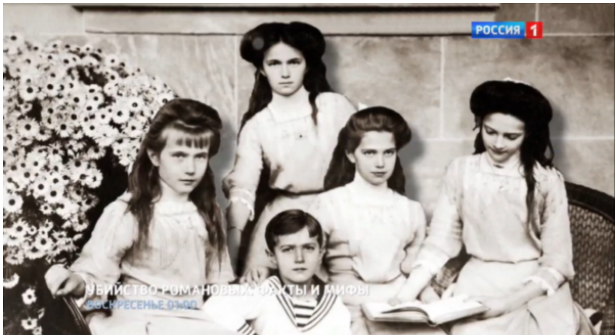
УБИЙСТВО РОМАНОВЫХ. ФАКТЫ И МИФЫ ВОСКРЕСЕНЬЕ 07:00