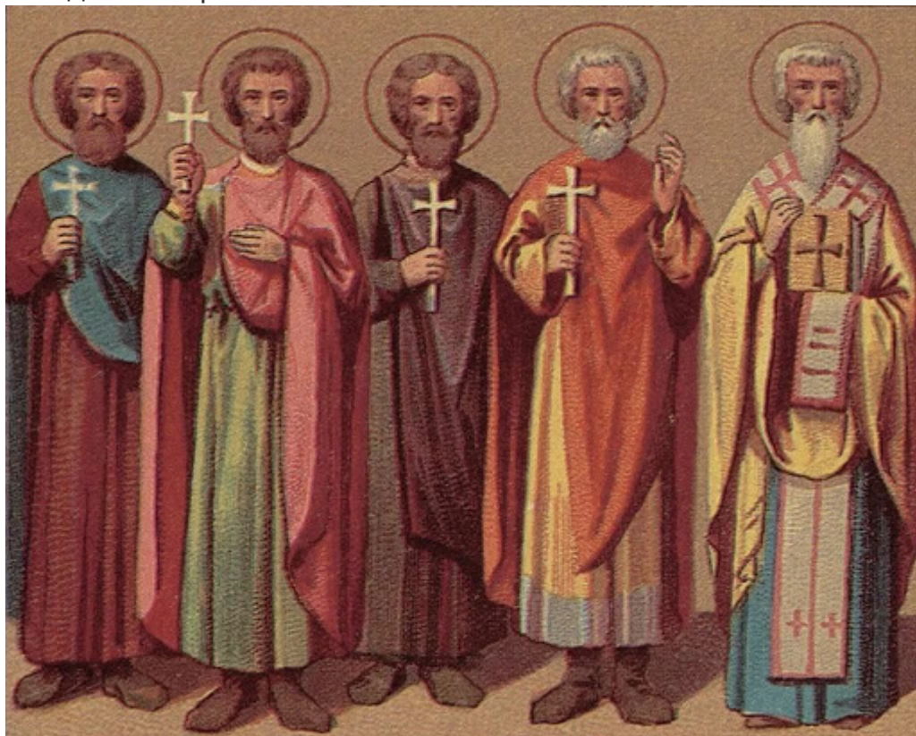
Священномученик Аполлинарий, епископ Равеннский

христианство. В Равенне епископ Аполлинарий проповедовал 12 лет, очень сильно укрепив местную христианскую общину. За это святитель неоднократно арестовывался, подвергался пыткам и ссылаясь, но и в ссылке активно проповедовал веру во Христа Распятого и Воскресшего. Разъярённые язычники однажды напали на святого Аполлинария и избили так сильно, что от полученных побоев старец скончался. Это произошло в 75 году от Рождества Христова.