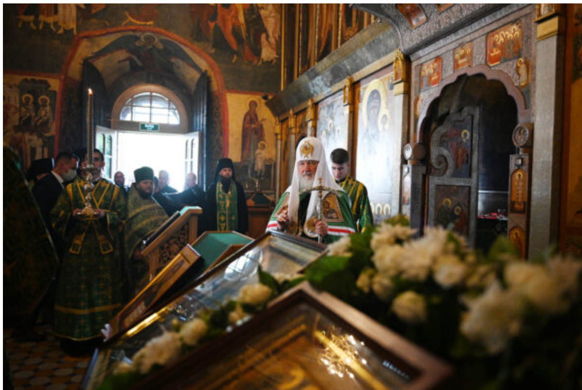
Патриаршее служение в день памяти прп Саввы сторожевского